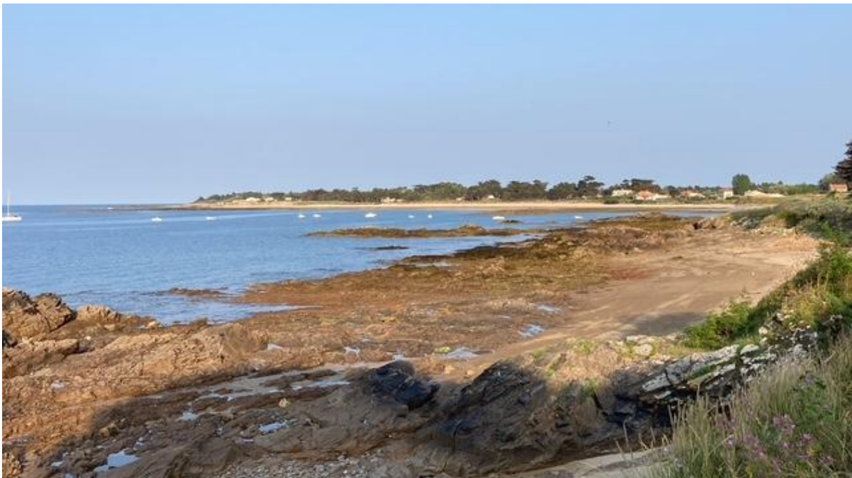
Noordkust van Ile de Yeu.

wilde draaien schrok ik, want uit een ander compartiment kwam net een grote veerboot naar buiten. Er zat niets anders op dan hard naar stuurboord uit te wijken en volle kracht achteruit te slaan. Gelukkig hoefde de boot geen waarschuwingssein te geven en hij draaide ruim voor mij langs naar buiten. Hij had een turboaandrijving die enorm veel hekwater en rond vliegend schuim produceerde, maar ik voer er gelukkig net ver genoeg vanaf. Ik moest even wachten op de schepen die in de marina hadden liggen wachten en daarna heb ik contact opgenomen met het havenkantoor om te vragen waar ik kon liggen. De toegewezen box was snel gevonden en toen ik die indraaide sprong de opvarende van het jacht dat in de box ernaast lag, de steiger op om mijn lijnen aan te pakken. De man had bepaald geen vriendelijke uitstraling en zei boe noch bah, maar ik was blij met zijn hulp en bedankte hem hartelijk. Zonder te reageren stapte hij weer snel op zijn schip.