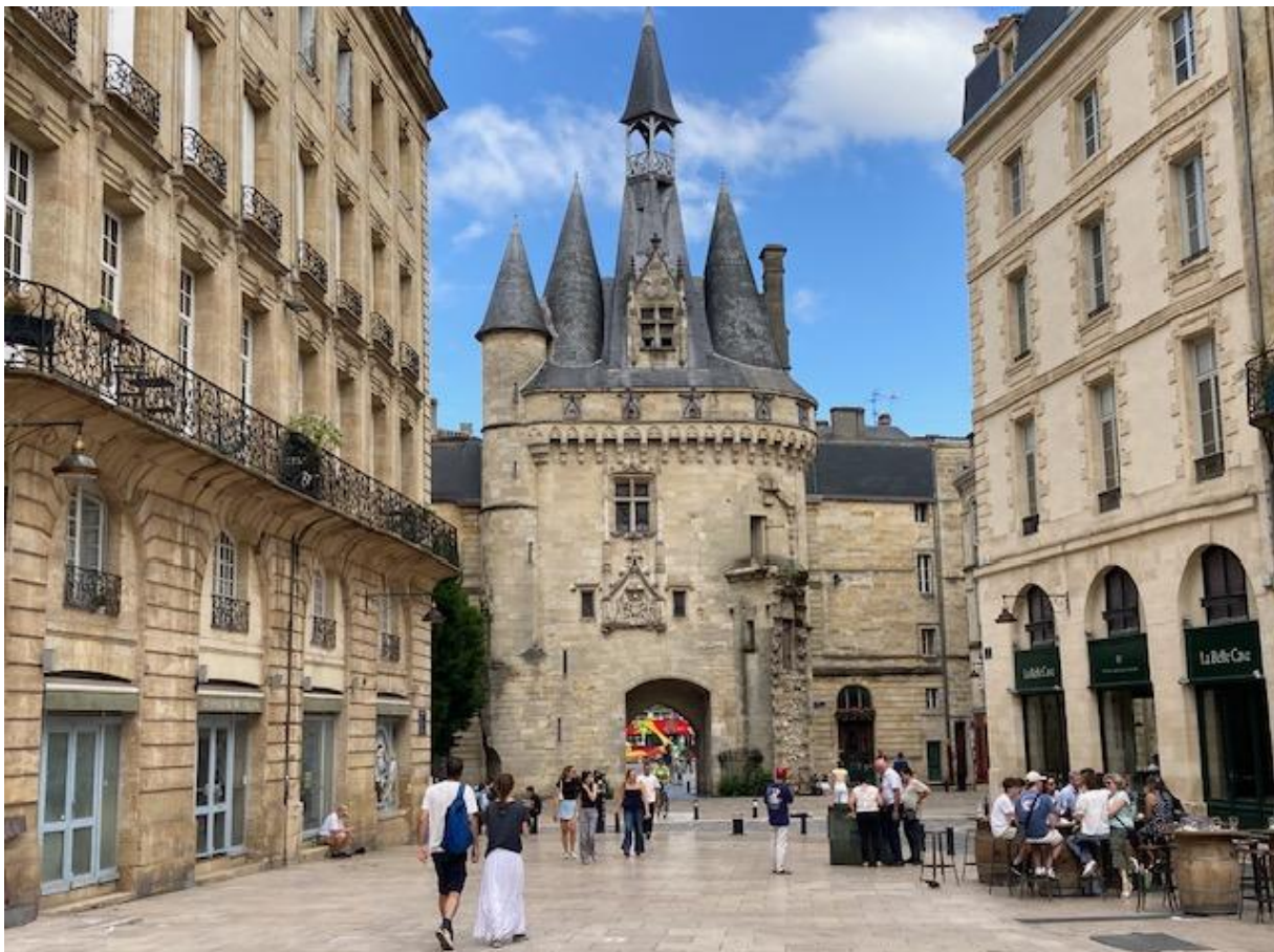
De stadspoort aan de rivierzijde.

Via schilderachtige nauwe straatjes ben ik richting de kathedraal en de vrijstaande klokkentoren gelopen. In een land met niet veel fietsverkeer ben je niet zo geneigd om op fietsers te letten, maar dat moest je hier wel doen. Er reden opvallend veel fietskoeriers rond, die hun bestelling natuurlijk zo snel mogelijk wilden afleveren maar het daarbij niet al te nauw namen met de regels. Toen ik in een drukke loopstraat even stilstond om een foto te nemen en daarbij een kleine pas naar links deed, werd ik geraakt door een van achteren komende vrouw op een fiets, gelukkig zonder vervelende gevolgen. De 114 meter hoge klokkentoren kon beklommen worden en dat leverde een schitterend uitzicht over de stad en de omgeving op. Daarna kon ik in de enorme Saint-Michelkathedraal wat uitrusten en van het indrukwekkende interieur genieten.