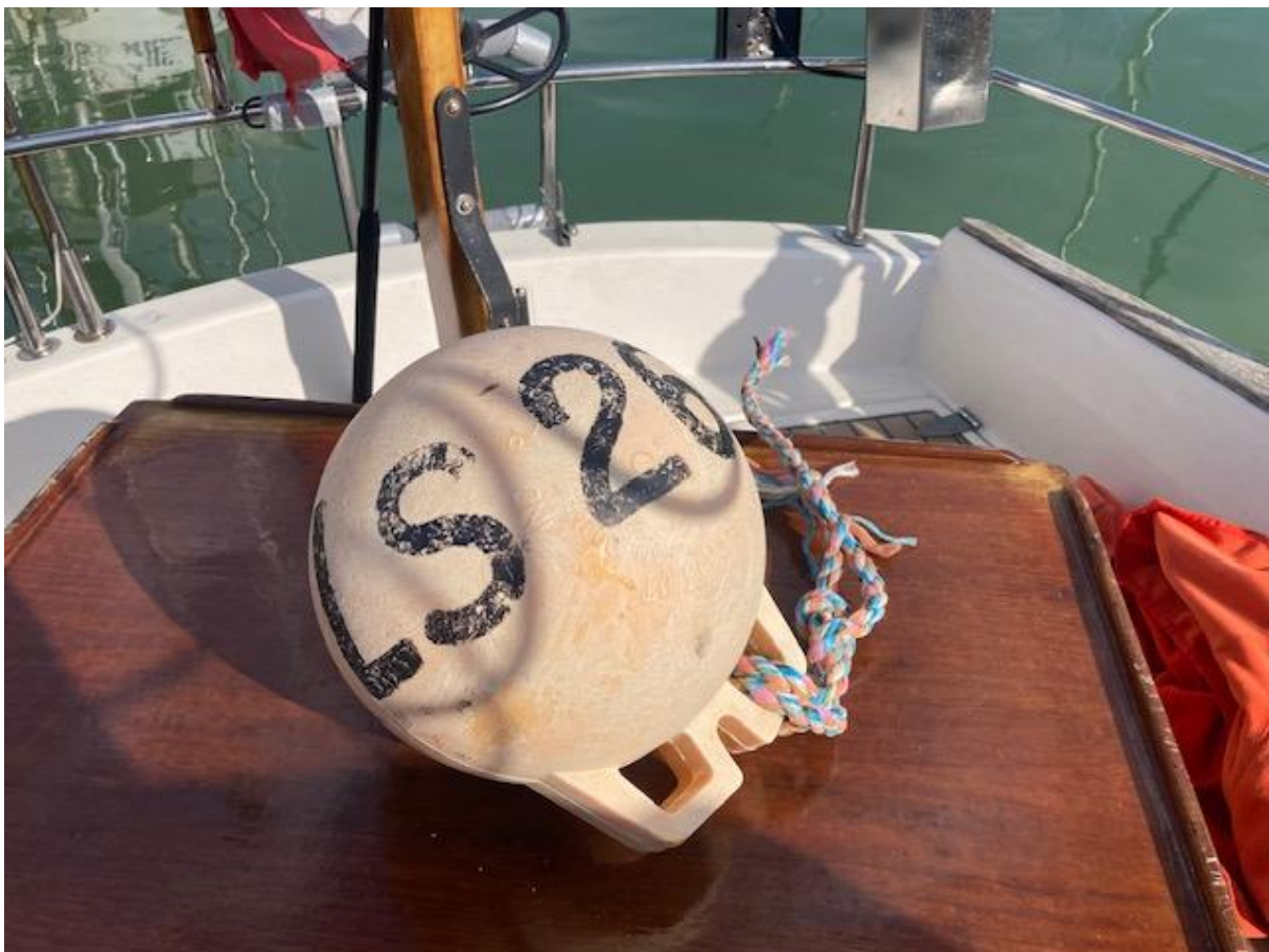
Het fatale kreeftenboeitje.

Waarschijnlijk waren de boeitjes van een visser uit Les Sables-d'Olonne, een grote vissersplaats aan de kust, want op het boeitje dat ik had losgesneden stond "LS", met daarachter het nummer van het vissersschip.