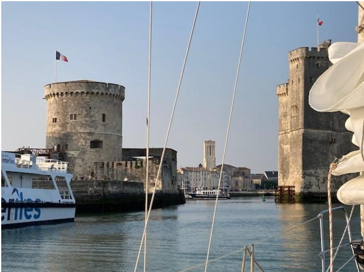
Bijna in de oude stadshaven van La Rochelle.

hoofdzakelijk lezend doorgebracht. De kust lag ver weg, het was een beetje heilig en het enige wat ik zag was water en een staalblauwe hemel. Ik had de wind in de rug, maar die voelde ik nauwelijks en op het schip was het behoorlijk warm.