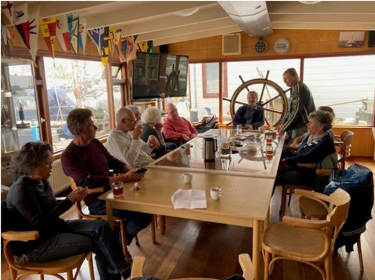
In de clubark van Het Y

hun haven spelen, zoals een wiebelige vingersteiger, groen uitgeslagen boten die zelden varen, overlast van klapperende vallen en gladheid op de steiger aan de rietkant. Ook werd teruggeblikt op de renovatie van de elektra, die mede dankzij de voortreffelijke organisatie door Stephan, goed is afgerond.