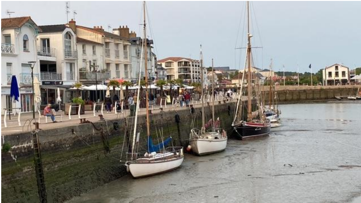
Oude stadshaven van Pornic.

In de vorige Geus heb ik verteld dat ik na een aantal dagen met veel wind en buien op de zaterdag voor pinksteren onder zeer zomerse omstandigheden naar de jachthaven van Pornic ben gevaren, een stukje ten zuiden van de Loiremonding. De volgende dag heb ik de laatste haven in Bretagne vaarwel gezegd en koers gezet naar Ile de Yeu, een eilandje in de Vendée, de regio tussen de Loire en de Gironde.