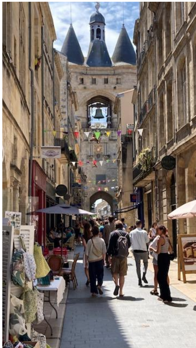
Oude binnenstad van Bordeaux met de stadspoort aan de landkant.

de namen van de dorpjes ook werden weergegeven in het Aquitaans, de met het Catalaans verwante taal die vroeger in heel Zuidwest-Frankrijk werd gesproken. De plaatsjes waar de trein stopte werden na een uur steeds groter en het was op een gegeven moment duidelijk dat we door de voorsteden van Bordeaux reden. Na anderhalf uur reed de trein het hoofdstation binnen en was ik dan toch in Bordeaux.