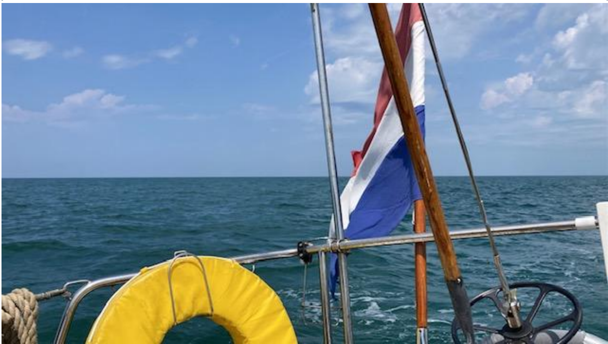
Onder zeer zomerse omstandigheden op weg naar de Gironde.

om de lijnen los te gooien, waren de buien al over de stad getrokken en brak de zon door. Daarna volgde er weer een vrij relaxte, lange tocht, eerst naar de zuidwestpunt van het eiland Oleron en daarna in een rechte lijn naar de noordwestelijke toegangseul van de Gironde. Net als twee dagen ervoor stond er te weinig wind om alleen op de zeilen voor het donker op mijn bestemming te zijn.