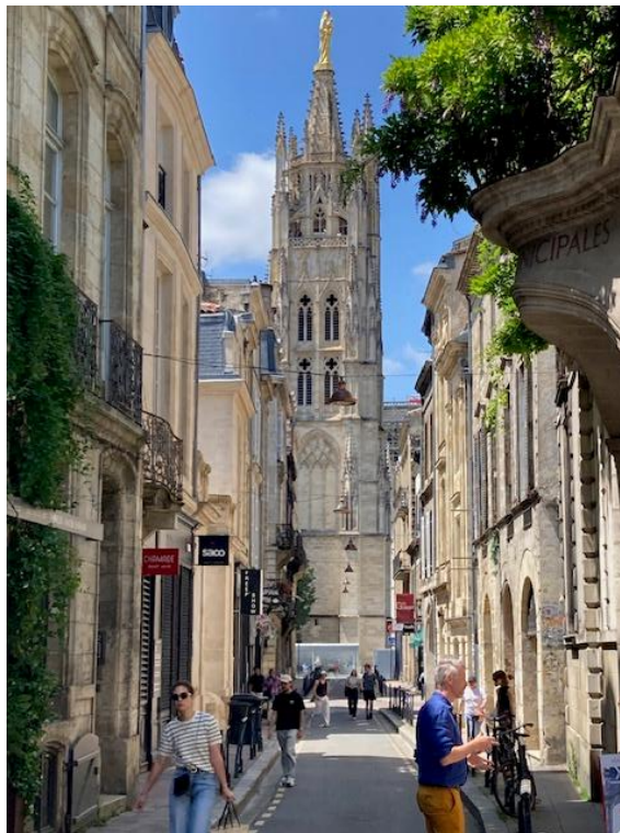
De 114 meter hoge klokkentoren van de Saint-Michelkathedraal.

Naar de oude binnenstad was het nog ruim een half uur lopen, maar het was geen onaangename wandeling. Omdat het zondagmorgen was, was het vrij rustig op straat en waren de winkels gesloten, maar wat me opviel was het grote aantal kapperszaken dat wel open was. Ik passeerde er tientallen, allemaal met personeel en klanten met een Noord-Afrikaanse herkomst. Toen ik het oude stadscentrum bereikt had, was het lunchtijd en op een terrasje onder een paar platanen op een klein pleintje heb ik een heerlijke salade genuttigd. Daarna had ik de hele middag de tijd om de stad te verkennen. Hij werd aan de land- en aan de rivierkant afgesloten door een monumentale stadspoort. De poort aan de rivierkant kon ook bezichtigd worden en de poort aan de landkant grensde aan een fraaie kerk waar kennelijk een feestelijke plechtigheid had plaatsgevonden, want ervoor stonden allemaal zeer netjes geklede mannen en vrouwen te praten en koffie te drinken met zwartgerokte jonge mannen die zo te zien priester wilden worden of dat misschien net waren geworden, een tafereel dat je in Nederland niet snel zult zien.