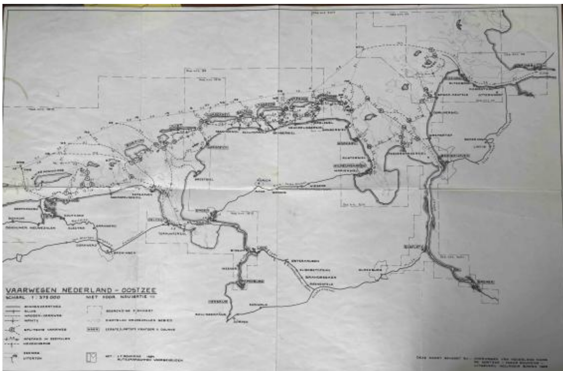
De kaart van Roukema,

We leggen de kaart van dit stuk wad, de DE12, voor ons op tafel. De kaart is moeilijker te lezen dan de kaarten van het Nederlandse en het Duitse wad met eilanden. Deze kaarten lezen per pagina van west naar oost. Je slaat een pagina om en vervolgt de reis oostwaarts. Ik zoom in op de DE12. De kaart loopt grotendeels van noord naar zuid. Het hoogste punt is het eiland Helgoland, zo'n 30 mijl uit de kust. Het zuidelijkste punt is ver op de Weser, voorbij Bremen. Ook de schaal is niet voor elke kaart gelijk. Het is zoeken naar waar de kaarten overlopen, naar waar dezelfde boei op beide kaarten te vinden is. Komend vanaf de Kaiserbalje op C10 naar de Fedderwasser Priel zoek ik de boei F12/MP2 op C14. Ik sla de kaarten heen en weer. Wat onderop C10 is, is bovenin C14. We raken snel het geheel uit het oog. Waar zitten we? Wat is de volgende stap? Ik scheur een pagina eruit.