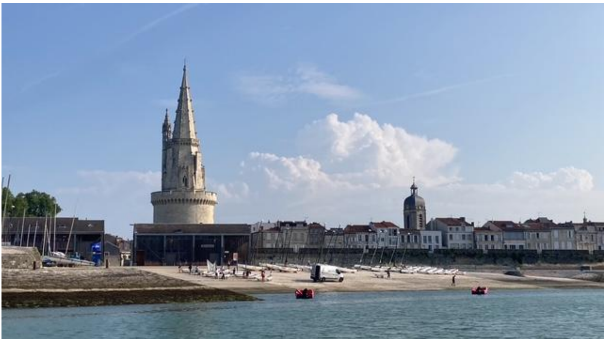
Afscheid van La Rochelle.

zeelieden. Om de tijd te doden hadden ze, behalve hun initialen, ook afbeeldingen van hun schip in de zandstenen binnenmuren gekerfd of soms zelfs uitgehouwen. Er waren fraaie kunstwerkjes bij. Ook de dag erna, toen het gelukkig wat minder warm was, ben ik in La Rochelle gebleven. Ik heb wat rondgewandeld in de buurtjes waar ik de vorige dag nog niet was geweest en heb een bezoek gebracht aan het maritiem museum. Omdat er vanuit La Rochelle veel koloniale expedities vertrokken heeft de stad een belangrijke rol gespeeld in de koloniale geschiedenis van Frankrijk en er werd ook veel geld verdiend aan de slavenhandel.