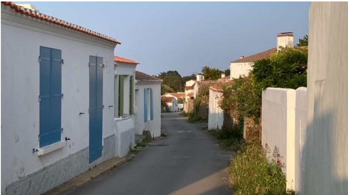
Ile de Yeux.

en daarna ben ik met een bocht over het midden van het eiland weer teruggefietst naar Port-Joinville, de hoofdplaats van het eiland, waar de marina was. Aan de architectuur was goed te zien dat ik in een zuidelijker deel van Frankrijk was beland. De huizen waren allemaal spierwit, de daken waren veel platter dan in Bretagne en Normandië en er lagen dezelfde buisvormige dakpannen op als in Italië en Spanje. De kust, met zijn lage kliffen en baaitjes met strandjes ervoor, was mooi, maar ik fietste bijna voortdurend tussen huizen. Bovendien liet het wegdek op veel plaatsen te wensen over. Er zaten nogal wat gaten in, en hoe vul je die dan op? Met de Franse slag, door er een paar emmers grind in te gooien. De fietspaden waren geen van alle bestraat. Van alle EU-landen gaat in Frankrijk het meeste geld naar de publieke sector, maar als je kijkt naar het wegonderhoud en de betonning en bebakening van vaarwegen, zou je dat niet zeggen.