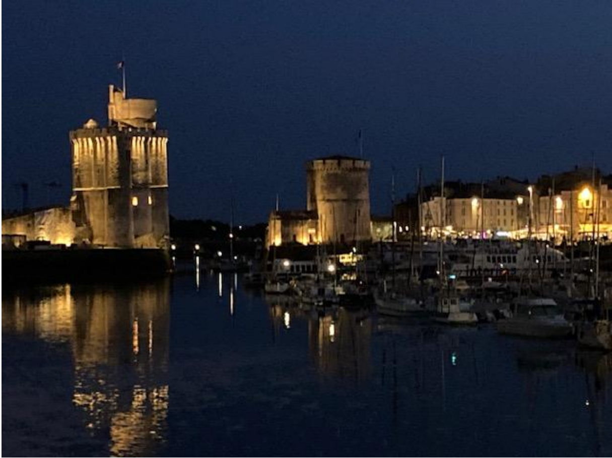
De oude stadshaven van La Rochelle wat later op de avond.

De volgende dag heb ik de stad verkend. Zoals veel Franse steden heeft La Rochelle een grote markthal waar groente, fruit en vooral vis wordt verkocht en in de straten rondom de hal was het die dag markt. Overal stonden kramen, vooral met groente en fruit, en het was er gezellig druk. Het enige minpunt was dat het in de loop van de morgen erg warm werd. In een smal schaduwrijk straatje heb ik buiten geluncht en daarna heb ik zoveel mogelijk plekken opgezocht waar het minder heet was. In de barokke kathedraal was het heerlijk koel en de metersdikke muren van de verdedigingstorens die ik de avond ervoor gepasseerd was, hielden ook de hitte goed buiten. De toren met de enorme gotische spits erop had ook als gevangenis gefungeerd. De meeste gevangenen, onder wie nogal wat Nederlanders, waren tijdens oorlogen krijgsgevangen gemaakte