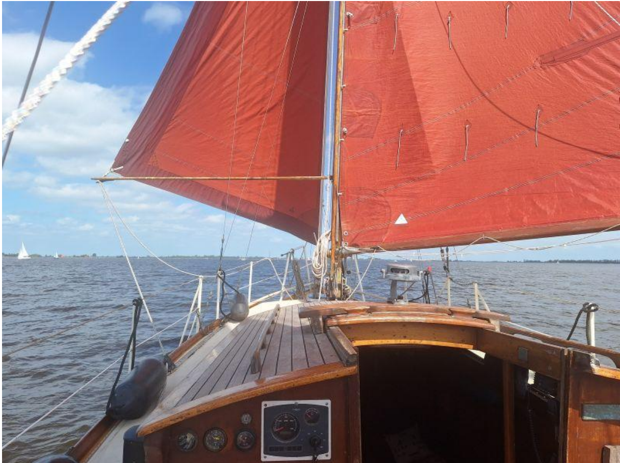
Plat voor het laken over de Fluessen en het Hegermeer

jongens met bier en boxen. Ik vraag gelukkig de andere kant op maar terwijl ik al het Hegermeer opvaar hoor ik het gedreun nog over de hele Fluessen schallen, hoewel de geluidsbron dat meer inmiddels al verlaten heeft.