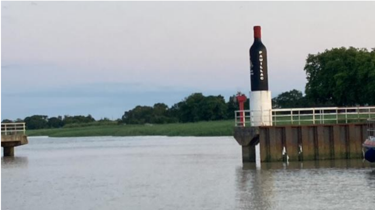
Havendam van Pauillac.

heb daarom de genua wat kleiner gemaakt, maar toen het toch nog veel te snel ging heb ik hem helemaal ingerold. Daardoor voer ik natuurlijk minder hard, maar ik dreigde toch nog zeker twee uur voor de kentering aan te komen. Dat wilde ik terugbrengen tot een uur. Er zat maar één ding op: de motor starten en die in zijn achteruit zetten.