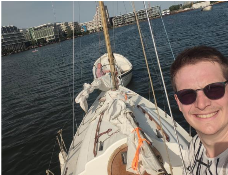
De Geus II sleept de Geus I naar de Diemerzeedijk.

Een vereniging vraagt natuurlijk ook toewijding, en ook daar draag ik graag aan bij. Ik heb al enige bestuurservaring opgedaan als penningmeester en relatiebeheerder van een stichting en een studievereniging. Ik ben dan ook zeker te porren voor bijvoorbeeld de kascontrolecommissie of simpel kluswerk.