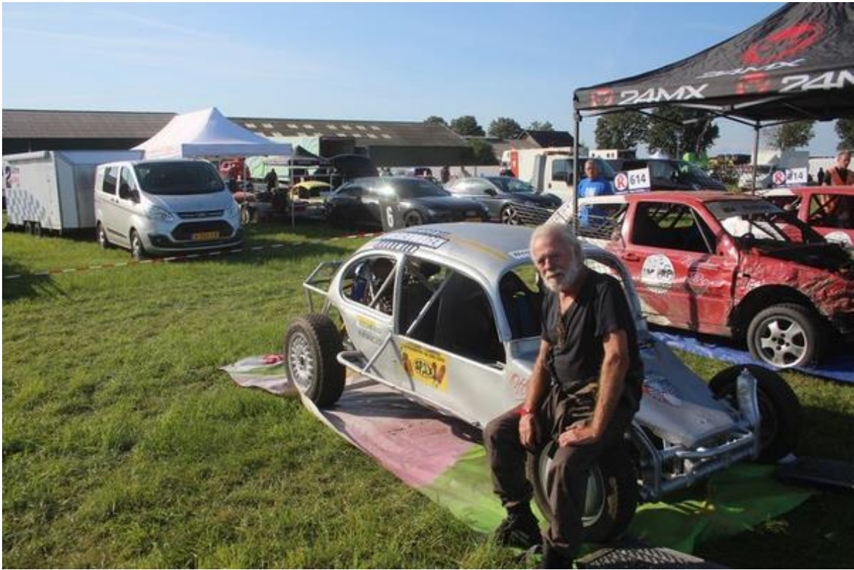
Zestienhoven on wheels.