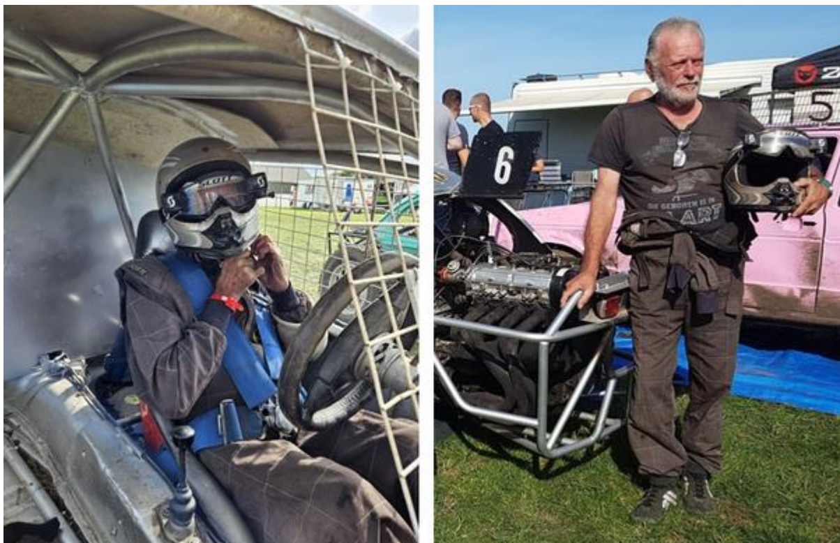
Links: zo krijgen we Francis op onze haven niet te zien! (Let op het rooster tegen de rondvliegende pollen.) Rechts: een statiefoto.

Voorafgaand aan elke wedstrijd moet er uiteraard een hoop gesleuteld worden. En vervangen. Denk aan de banden. Die slijten, en niet zo'n klein beetje.