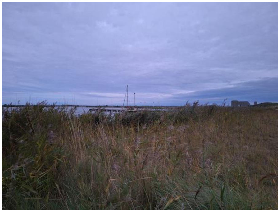
De Markerwadden voor mezelf.

te maken over de kans dat het daar vol is. Integendeel, er lag nog één andere boot.