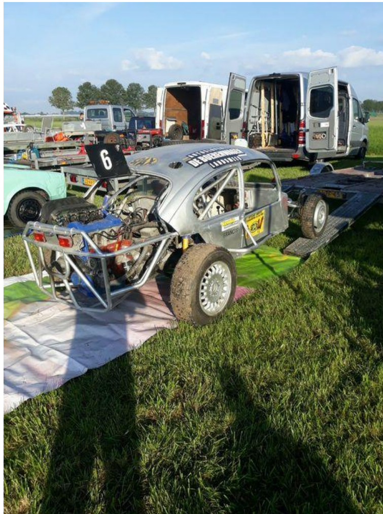
De motor hangt in een kooi achter de auto.