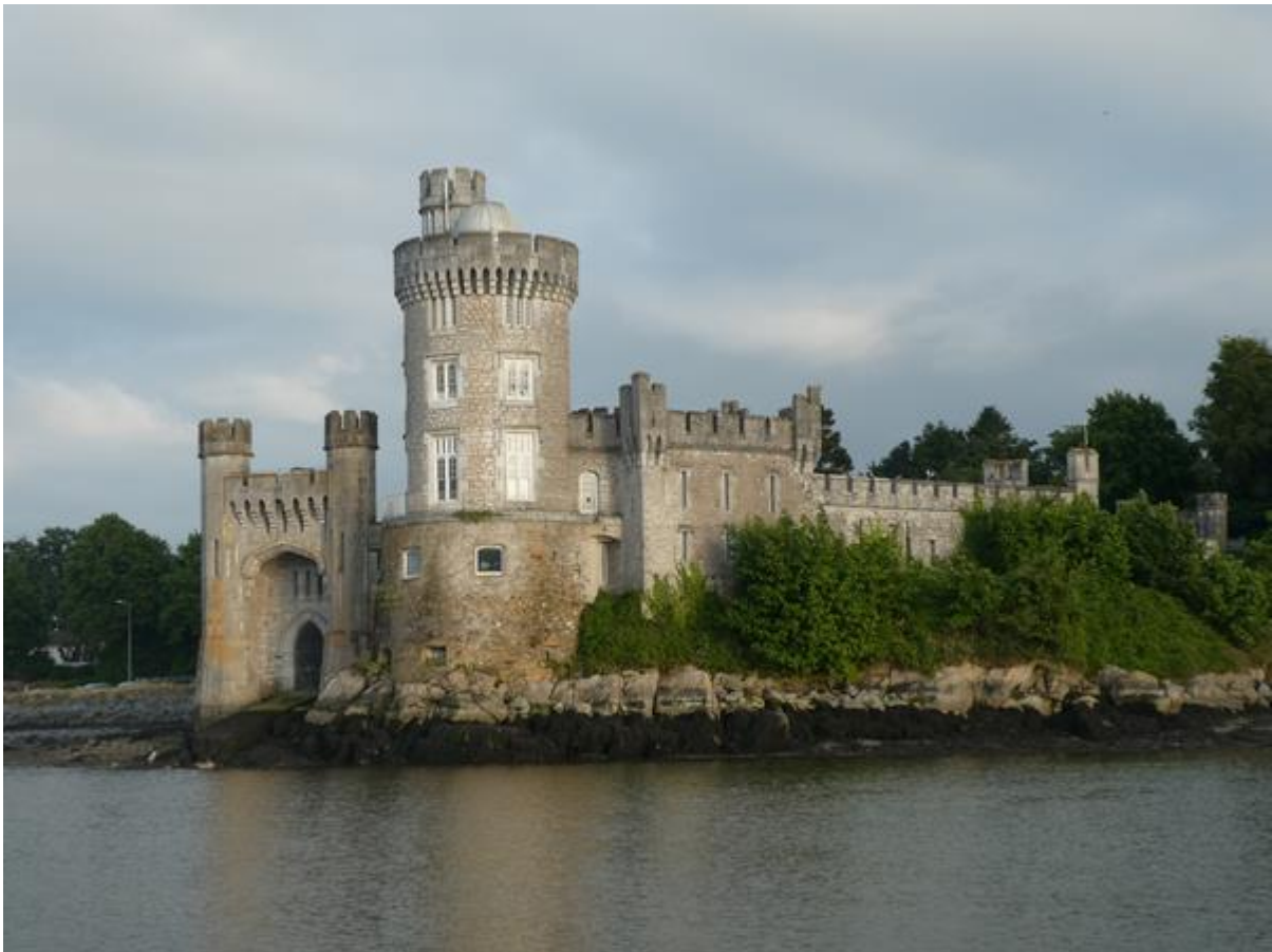
Kasteel langs de Lee, vlak voor Cork.

hoge torenspits torende boven alles uit. Aan de kade lag een cruiseschip dat zich gereed maakte om te vertrekken. Gelukkig voer het al aan de andere kant van de vaargeul voordat ik de aanlegkade passeerde. Na een paar scherpe bochten draaide ik de Lee op, de rivier waaraan Cork ligt. Vanwege de vernauwingen en verbredingen leek die wel wat op de rivier waarover ik naar Waterford was gevaren, maar hier stond veel meer bebouwing langs de oevers. Op een gegeven moment liep de rivier door een groot meer, daarna versmalde hij zich weer en kwam Cork in zicht. Vlak voor de stad was een kade waaraan containers werden gelost. Op de oever aan bakboord stond aanvankelijk nogal wat industrie, maar ik passeerde ook een kasteel. Aan de andere kant was een langgerekte heuvelwand met huizen erop.