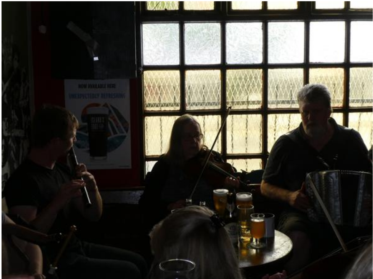
“Open session” in een pub in Cork.

de het musiceren in de pub. Zij had haar viool bij zich en samen oefenden ze. Daarna kon ik een hapje mee-eten.