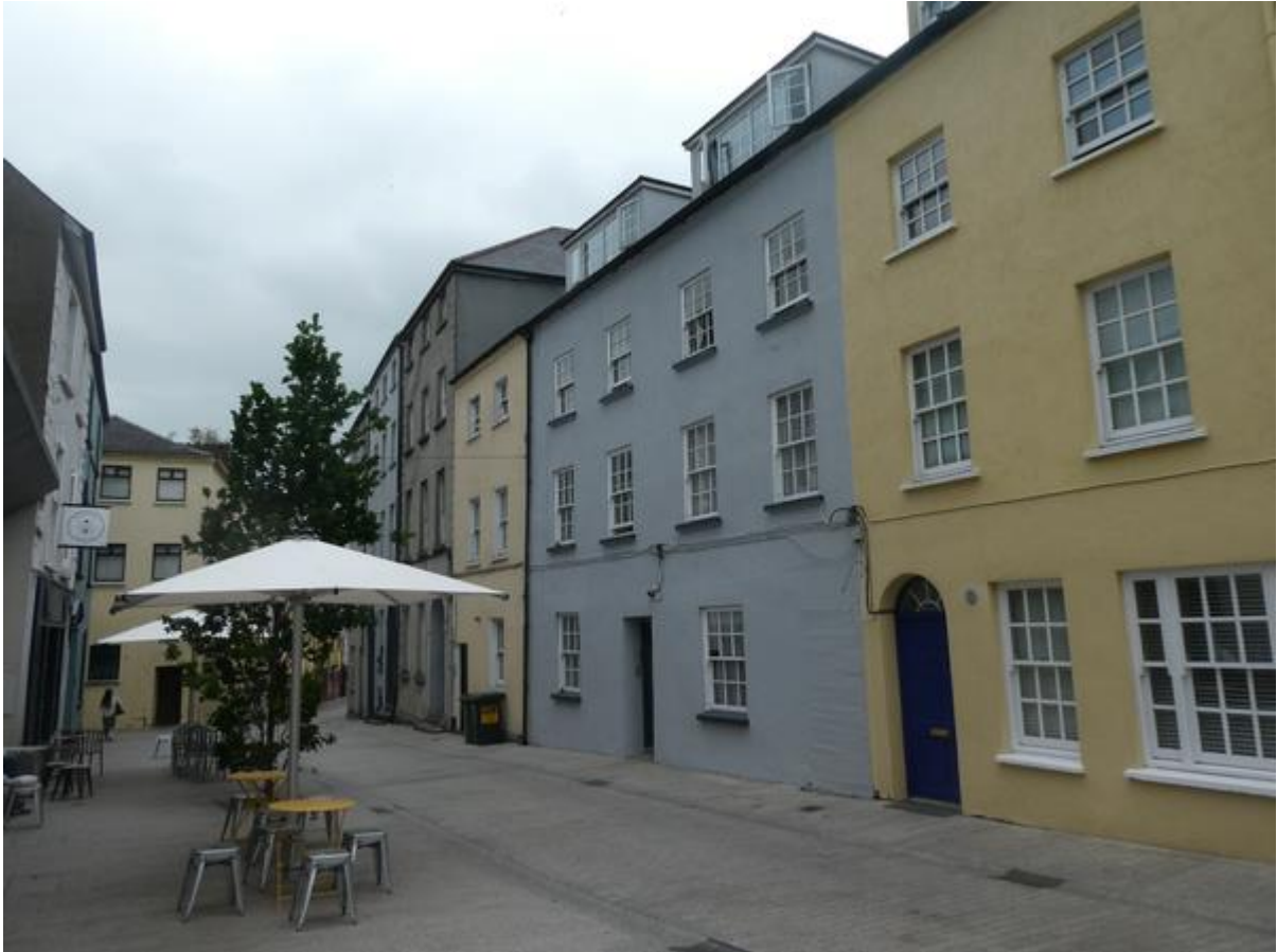
Eén van de weinige oude straatjes in Waterford.

Het openen van het hek met behulp van de telefoon ging prima en dat was gelukkig ook het geval bij de deur van de douche- en toiletruimte. Die kon wel een opknopbeurt gebruiken. De deur was verveloos en begon al een beetje te rotten en toen ik de douchecabine wilde binnenstappen golfde de vloer onder mijn voeten. Waarschijnlijk waren de planken weggerot en zorgde het daaroverheen gelegde zeil ervoor dat ik niet in de kruipruimte belandde, maar de douche zelf was voortreffelijk.