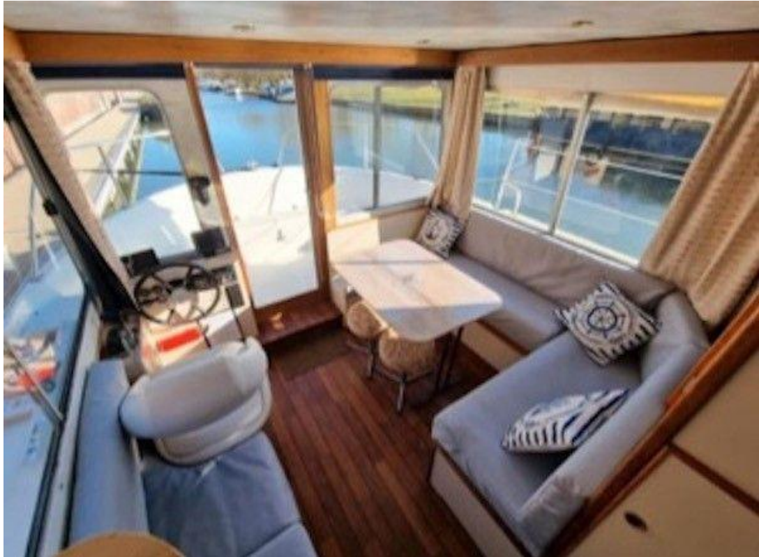
De zit- en stuursalon, met veel licht van buiten.