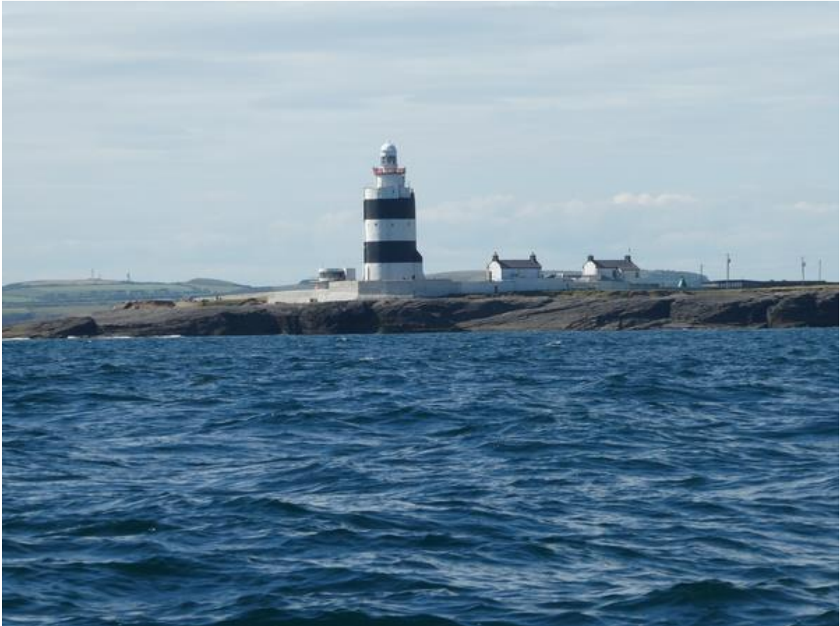
Bijna bij de monding van de Sour.

In de januari-Geus heb ik verteld dat ik na een snelle en rustige oversteek lag aangemeerd in Kilmore Quay, een stukje ten westen van de zuidoostpunt van Ierland. Vandaaruit wilde ik beginnen met mijn 'rondje Ierland'. De bedoeling was om eerst de zuidkust langs te varen. Mijn eerste bestemming was Dunmore East, aan de monding van de rivier de Sour. Die wilde ik opvaren om een bezoekje te brengen aan Waterford, de grootste plaats in de regio.