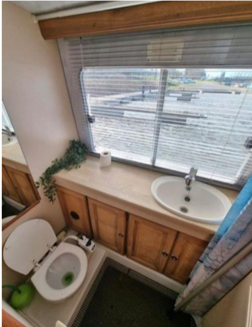
De was- en toiletruimte, ook met een weids uitzicht.

Dag 6. We vertrokken uit Nijmegen en zetten koers naar de Waal. Mijn zoon zou in Wijk bij Duurstede door zijn moeder worden opgehaald. Na vijf dagen met die oude mannen trok hij het echt niet meer. Hij zal wel geen echte bootjesman worden, zoals de rest van de familie, was mijn analyse na deze vaarervaring. Nadat zoonlief van boord was, maakten oom en ik er een lange vaardag van door in één stuk verder te varen naar Amsterdam.