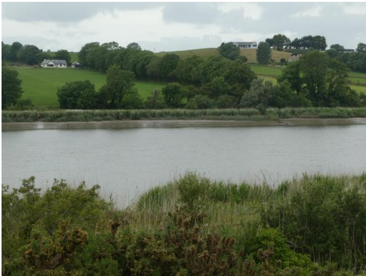
Uitzicht over de Sour tijdens mijn fietstochtje.

De volgende dag ben ik nog in Waterford blijven liggen, nu om wat van de omgeving te zien. Langs de rivier liep een toeristisch fietspad, vlak langs een oud spoorlijntje waarover vroeger de treinen reden die de talloze leren die de armoede wilden ontluchten naar de passagiersschepen brachten die vanuit Waterford naar de Verenigde Staten voeren. In totaal zijn er 10 miljoen leren geëmigreerd, vooral naar dat land. Nu reed er een toeristisch treintje. Telkens als het passeerde toeterde de machinist en werd er uitbundig gezwaaid. Het uitzicht was schitterend. Vlak naast het pad waren beboste heuvelwanden en aan de andere kant keek ik uit op de kronkelende rivier met daarachter heuvelland met hoofdzakelijk weilanden, allemaal omzoomd door hagen van bomen en struiken. Het versilde vrijwel niet van het landschap in Cornwall en Devon. Wat me daar en ook hier opviel was de enorme bloemenrijkdom langs de bermen. Er groeiden vooral veel margrietten en nergens werd de vegetatie overwoekerd door brandnetels en braamstruiken, zoals bij ons. Ik neem aan dat de Ierse regering dan ook niet de draconische maatregelen hoeft te nemen die bij