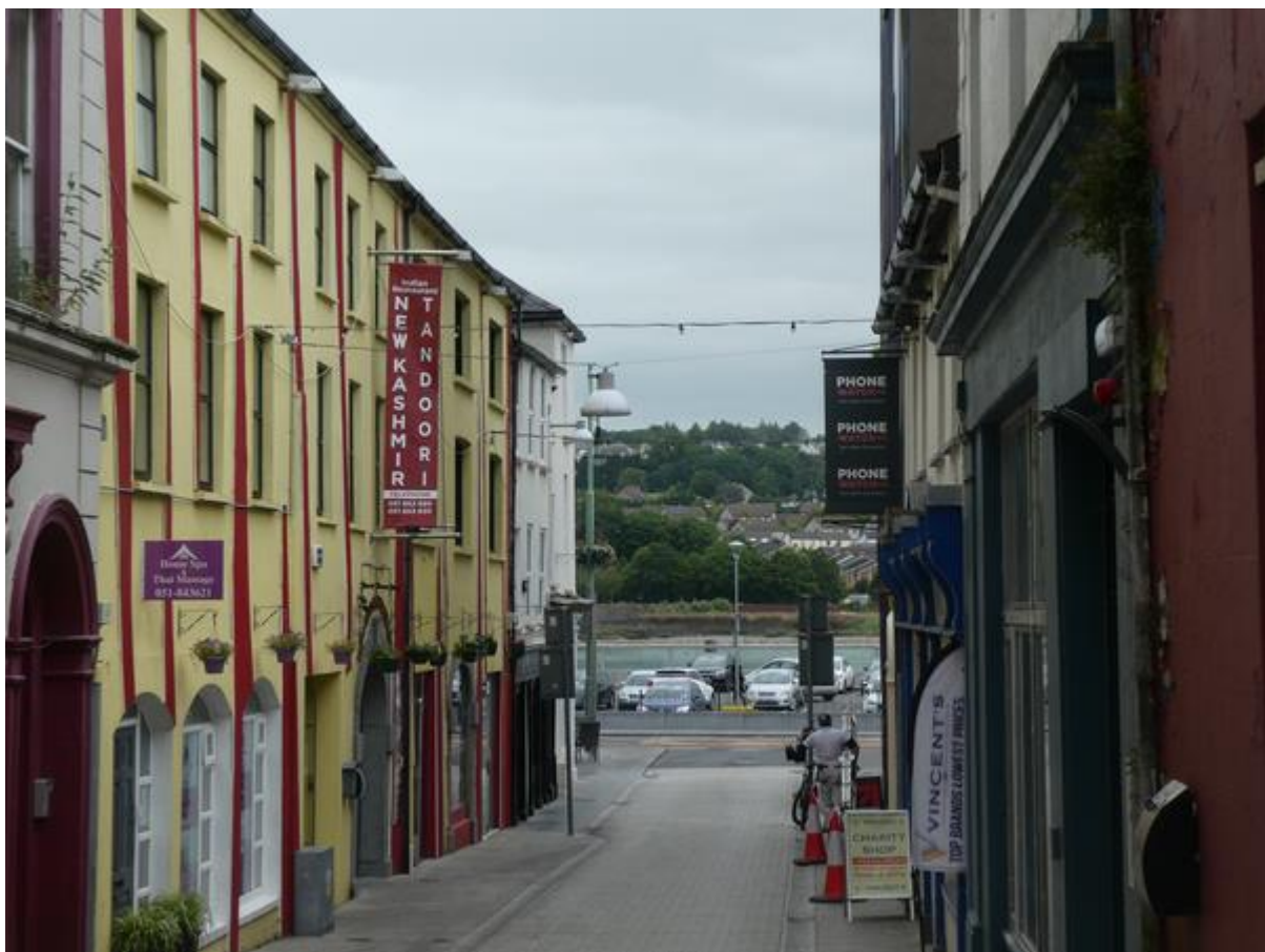
Waterford, doorkijkje naar de Sour.