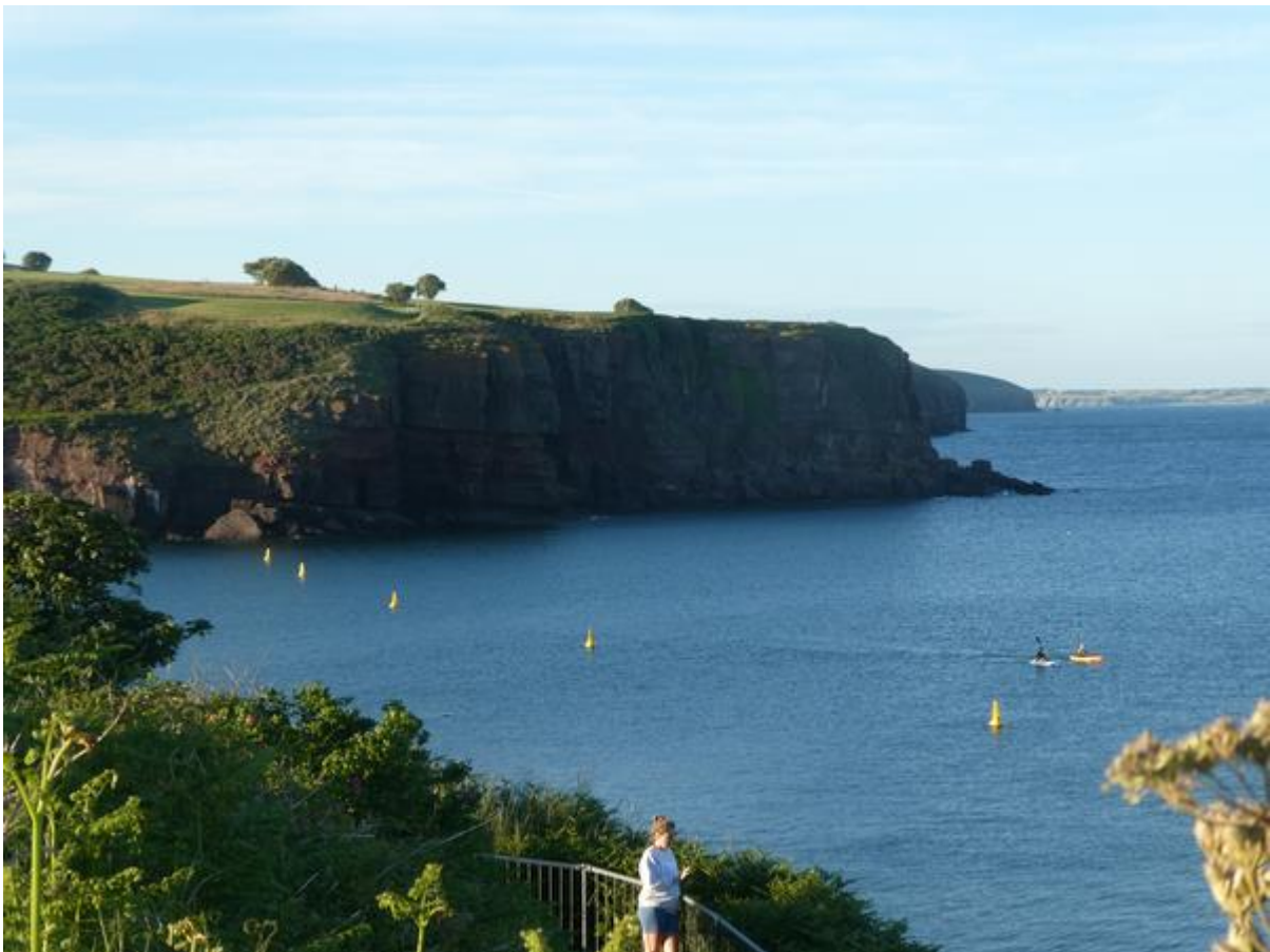
Westoever van de Sour bij Dunmore East.

bomen uit. Ik heb er 's avonds een leuke wandeling gemaakt. De plaats had heel wat meer allure dan het simpele, vrij kale Kilmore Quay. Het was een soort Blaricum of Laren op z'n lers, met hoofdzakelijk 19 e -eeuwse huizen en een paar oude hotels met gazons en enorme bomen eromheen. Vlak voor de klifrand lag een park met mooie doorkijkjes over de riviermonding en de haven, waar ik mijn schip kon zien liggen. Een trap leidde naar een idyllisch baaitje met een miniem strandje. Ik was blij dat ik hier-naartoe was gevaren.