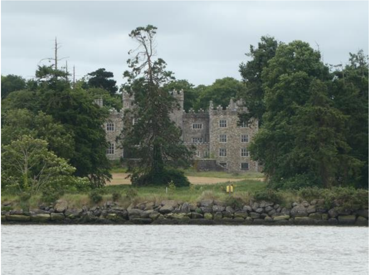
Landhuis langs de Sour.

lijk werd de plotselinge windtoename grotendeels veroorzaakt door tunnelwerking langs de heuvelwand, want toen die lager werd nam de wind af, maar het bleef toch veel harder waaien dan aan het begin van de tocht.