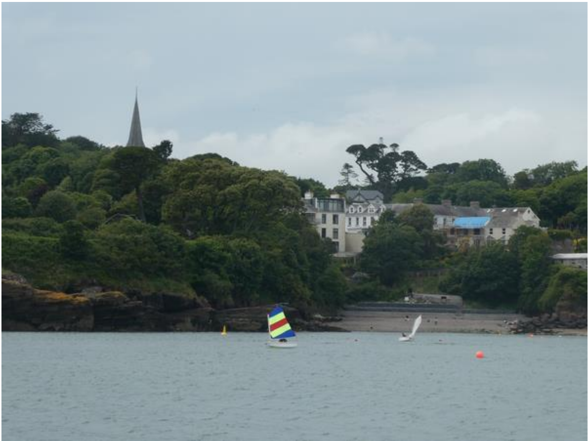
Uitzicht op Dunmore East, onderweg naar Waterford.

bussen te wachten voor een sightseeingtour. Er werd flink getoeterd, maar omdat het jacht de haven verliet had het voorrang. Niet lang erna kreeg ik een nieuwe buurman, weer een solozeiler van ongeveer mijn leeftijd, maar afkomstig uit Frankrijk. Ook hij was een praatgraag type. In zeer rap Frans vertelde hij dat hij in Parijs woonde en zover mogelijk naar het noorden wilde zeilen, het liefst naar IJsland. Ik doe het hem niet na. Hij ratelde aan een stuk door, maar vanwege mijn beperkte Franse woordenschat verstond ik de helft niet. Dat wist ik blijkbaar aardig te camoufleren want hij complimenteerde me met mijn voortreffelijke Frans.