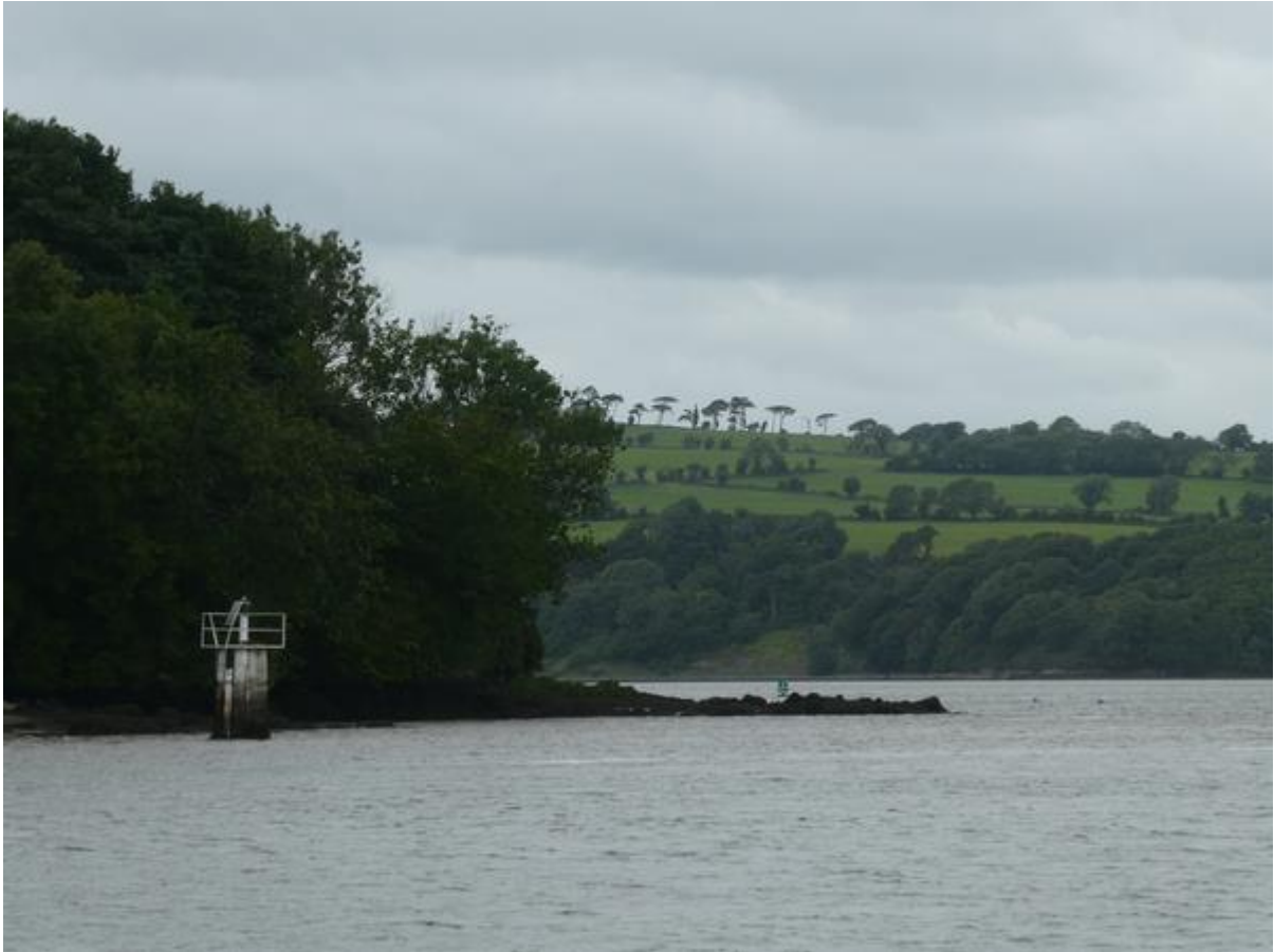
De Sour, onderweg naar Dunmore East.

losgooien. De buurvrouw stond met een pikhaak in haar hand naast het windmolentje om mij in geval van nood weg te duwen. Gelukkig hoefde zij niet in actie te komen. Toen de achterlijn was losgegooid draaide ik uitgewuifd door de bureen mooi de rivier op.