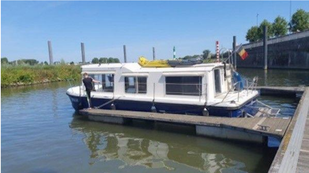
Onze Bonkie in de haven in Namen, België.

Na contact te hebben gehad met een kennis die ook in de scheepshandel zit, besloot ik om een boot aan te schaffen die in België in de haven bij Namen lag. Ze is 9,30 meter lang en 3,50 meter breed. De motor, een Yanmar 4 cilinder 55 pk, stuwt haar voort. Het is een oude verhuurboot en van oorsprong een Frans product, van Jeanneau.