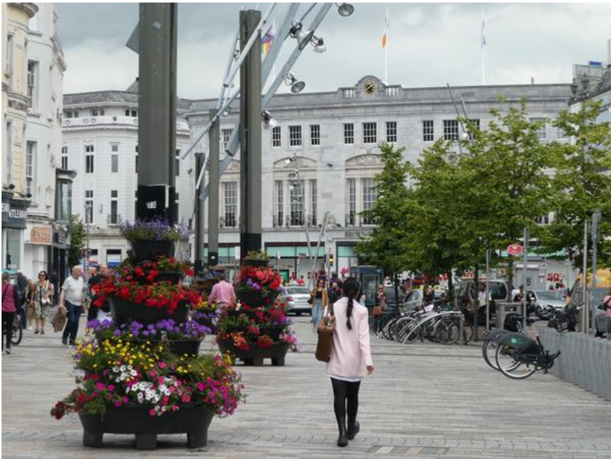
Hoofdstraat van Cork.

Ik lag bepaald niet op het mooiste plekje van de reis. Aan de overkant lag een enorme stapel boomstammetjes te wachten op verscheping en daarachter stond een grotendeels uit glas bestaand kantoorgebouw, en aan de andere kant keek ik uit op de voormalige douaneloods, een 19 e -eeuws grijs gebouw met getraliede vensters. Het was nog net geen ruïne en de voegen tussen de ruwe natuurstenen vormden een rijke voedingsbodem voor varens en andere gewassen. Sommige stonden in bloei en dat vrolijkte de boel gelukkig wat op. Het voordeel van het plekje was wel dat het op een steenworp afstand van het stadscentrum lag. 's Middags ben ik daarnaartoe gelopen. Het was er behoorlijk druk en daardoor ook erg gezellig. Opvallend waren de vele zitplekken en terrasjes, één straatje bestond zelfs helemaal uit terrassen. Tussen de vrij smalle, recht op elkaar staande straten kronkelde de brede boulevardachtige hoofdstraat van de stad. Op een plek waar veel bankjes stonden speelden vier oude knarren weemoedige Ierse liedjes. Achter hen stond de Ierse vlag fier te wapperen.