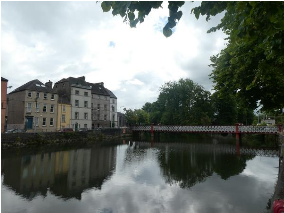
De Lee in de buurt van het Cork Public Museum.

ging weer met een andere code open. Ik wilde die al intoetsen, maar ik merkte dat ik het hek gewoon open kon duwen. Dat was in de dagen ervoor niet het geval geweest.