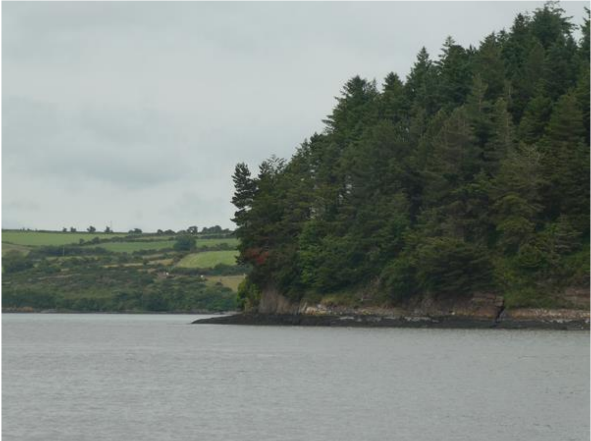
Oever van de Sour.

hoge klifwanden met daarboven zacht glooiend land waarop wat boerderijen stonden. Langs de tweede verbreding lag aan beide kanten geleidelijk oplopend heuvelland en ik passeerde een paar dorpjes. Daarna werd de westelijke oever een stuk hoger en voer ik dicht langs een steil oplopende heuvelwand, met hier en daar wat huizen tussen het geboomte. De vaargeul was vrij smal, maar gelukkig goed betond.