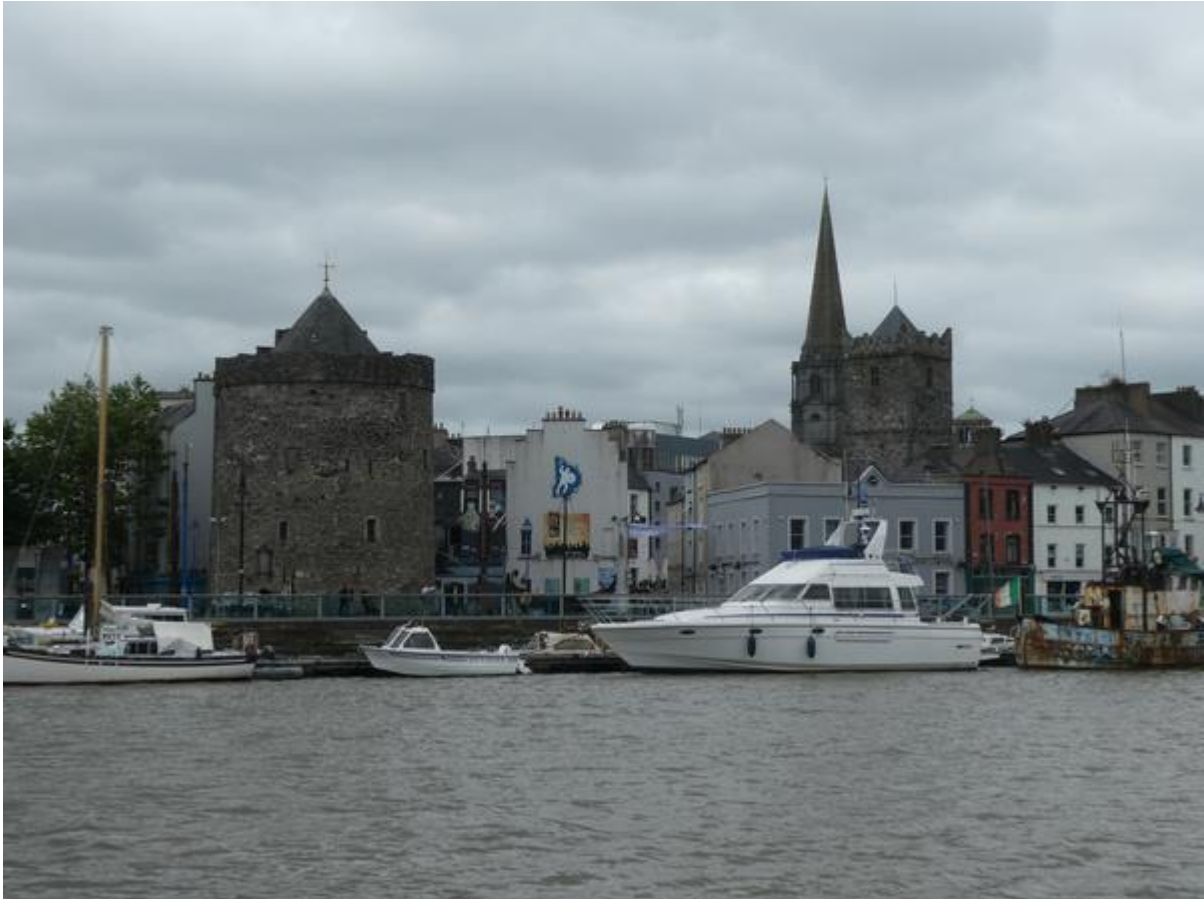
Bijna aangemeerd in Waterford. Links de oude verdedigingstoren.

gedacht had. Vanaf de boot kon ik mijn achterlijn gemakkelijk om een bol-der gooien en door vervolgens flink gas te geven en het schip hard naar stuurboord te sturen, draaide de boeg keurig naar de steiger.