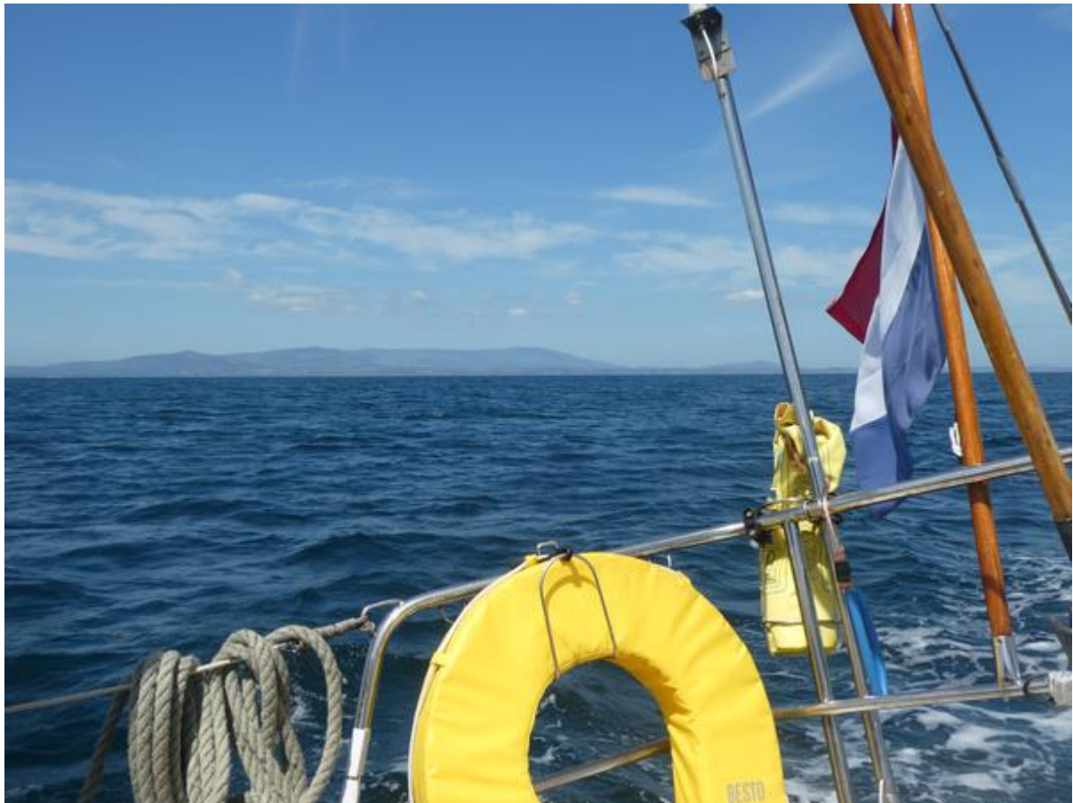
Onder ideale zeilomstandigheden op weg naar Crosshaven.

Het leek een ideale zeildag te worden. De zon scheen overvloedig, de temperatuur was aangenaam en het uitzicht op de kliffen en baaien was schitterend en werd nog mooier toen ik ter hoogte van de ruim 700 meter hoge, langgerekte bergrug van de Monavullagh Mountains voer. Maar de wind begon steeds meer naar het westen te draaien en iedere keer was het weer de vraag of ik de volgende kaap nog in één slag kon halen. Door zelf te sturen lukte dat in het begin nog net, maar op een gegeven moment zat er niet veel anders op dan de genna in te rollen en de motor weer het werk te laten doen. Alleen het allerlaatste stuk, toen ik moest afvallen om naar de mondig van Cork Harbour te koersen, kon ik nog even lekker zeilen. De vuurtoren en de witte huizen op de oostkaap van de monding stonden te pronken in de avondzon en aan beide zijden rezen hoge heuvelwanden op, aan de westkant met een groot fort erop. Maar ik moest goed opletten, want vanaf zee kwam een schip aan dat ook de mondig opvoer. Omdat ik een stukje verder de rivier moest opdraaien waaraan de jachthaven lag, heb ik de bakboordzijde van het vaarwater opgezocht. Daarna