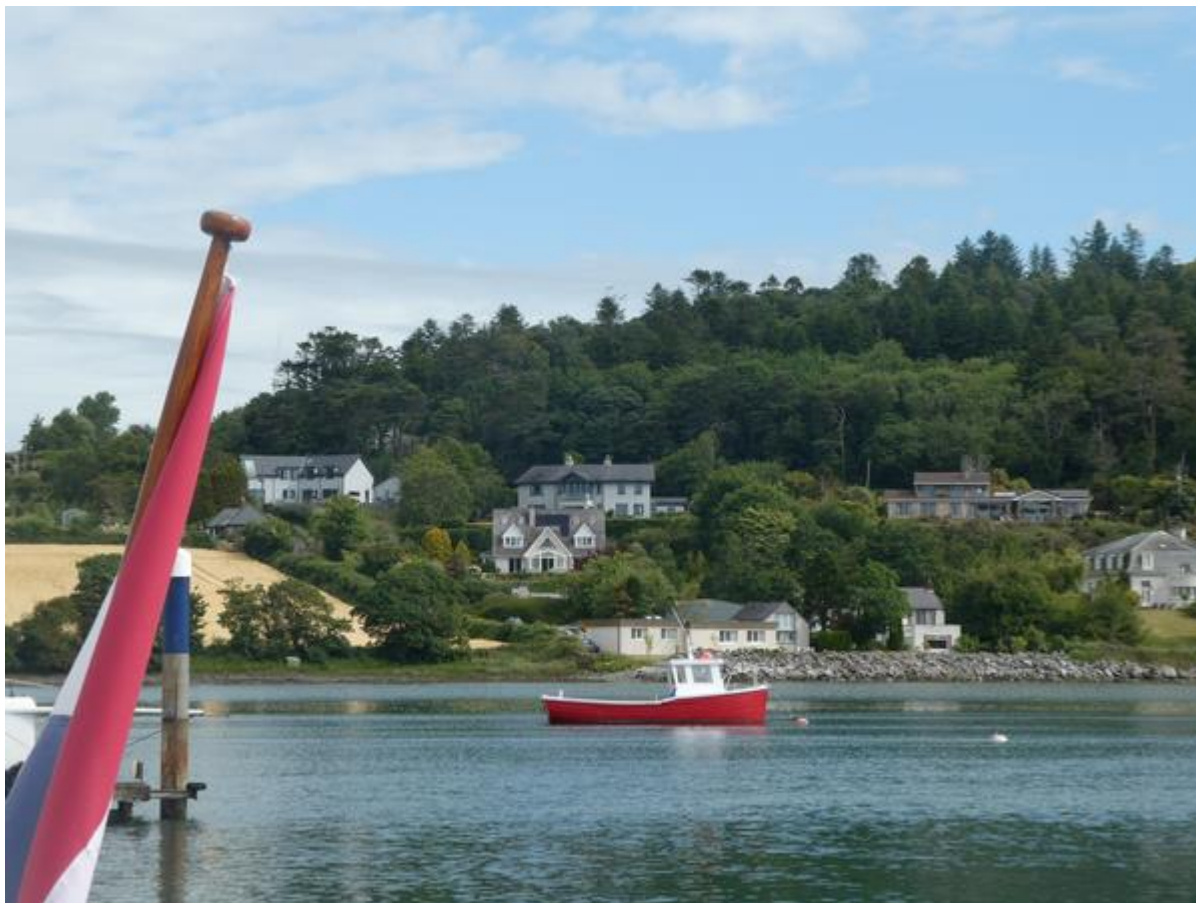
Uitzicht in Crosshaven.

De haven was van de oudste jachtclub ter wereld, de in 1720 opgerichte Royal Cork Sailing Club. Na het douchen en betalen van het havengeld had ik nog bijna de hele dag de tijd om de omgeving te bekijken, want om naar Cork te varen had ik de vloedstroom nodig en die begon pas tegen het eind van de middag te lopen. Om van het uitzicht over Cork Harbour te kunnen genieten ben ik door het dorpje naar boven gewandeld. Ik passeerde twee basisscholen, de ene voor jongens, de andere voor meisjes, waar de kinderen, allemaal in schooluniform, met dozen en tassen met boeken naar huis liepen, Het was 21 juni en kennelijk begint dan hier de zomervakantie.