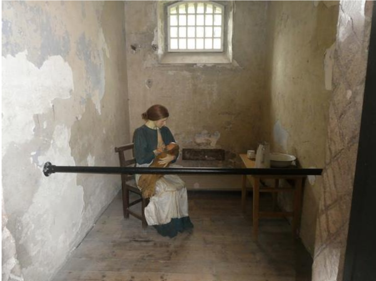
Cel in de Cork City Goal.

De Crawford Art Gallery bevat hoofdzakelijk de collectie van de rijke bierbrouwer Crawford en is grotendeels gevuld met werk van lokale kunstenaars en de collectie sloopsschilderijen die aan het museum geschonken is door de havendienst van Cork.