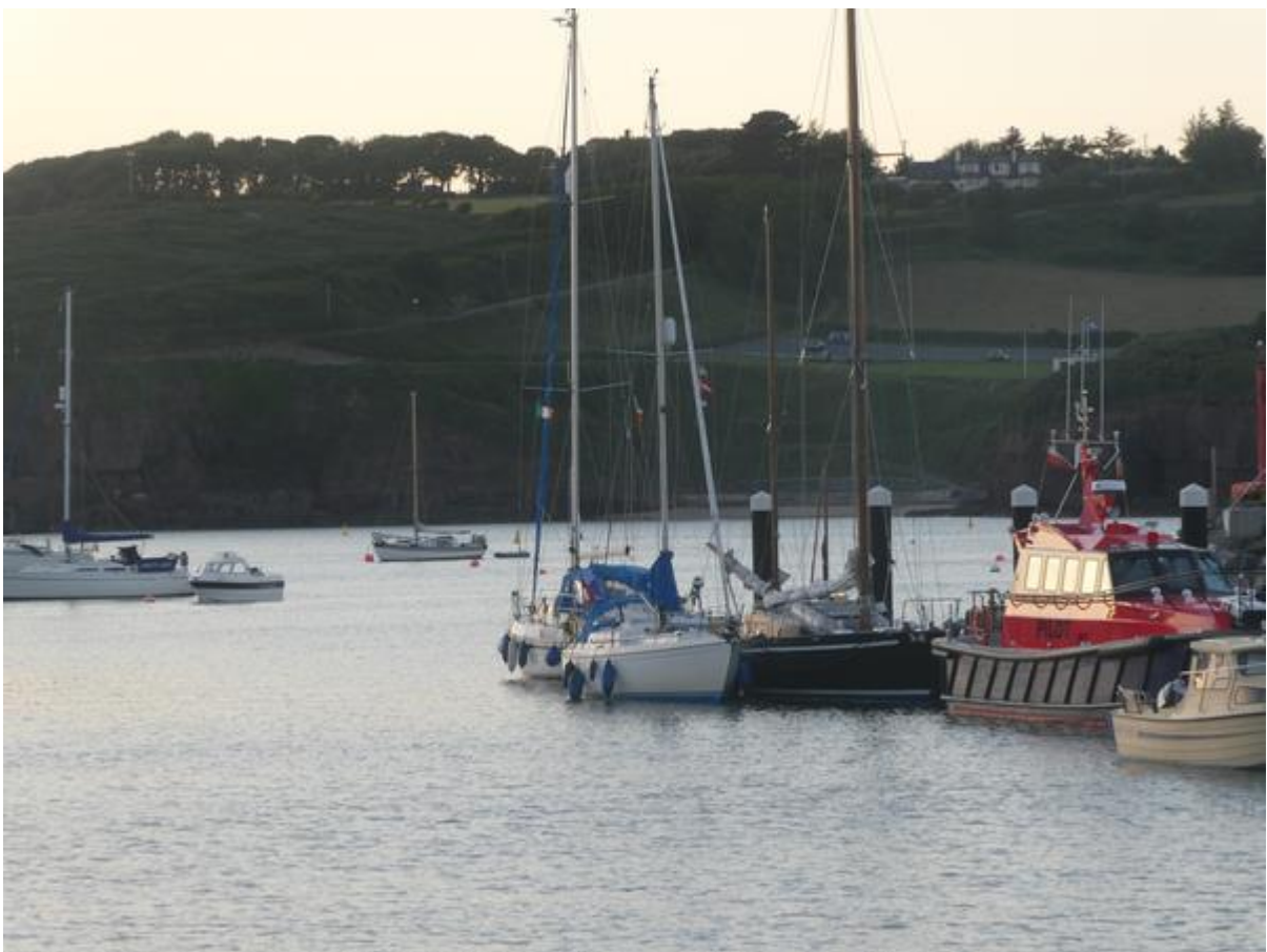
Aangemeerd in Dunmore East.

waren de kliffen een stuk hoger. Ik had alle tijd en ruimte om het grootzeil te strijken en het schip verder in gereedheid te brengen voor het aanleggen. Voor passanten was er een drijvende steiger aan het uiteinde van de havendam. De rest van de haven was bestemd voor vissersschepen. De steiger was vrij kort en omdat hij ook werd gebruikt door de loodsboot en een paar visbootjes, konden er niet meer dan twee of hooguit drie jachten langs liggen. Die plaatsen waren bezet en ik besloot vast te maken aan een wat antiek lers jacht. De eigenaar was ook een solozeiler van ongeveer mijn leeftijd en zoals de meeste leren zat hij bepaald niet om een praatje verlegen. Toen ik vertelde dat ik de volgende dag door wilde varen naar Waterford, gaf hij waardevolle adviezen over de beste vertrektijd. Dat zou mij uren besparen want er stond op de rivier verschrikkelijk veel stroom.