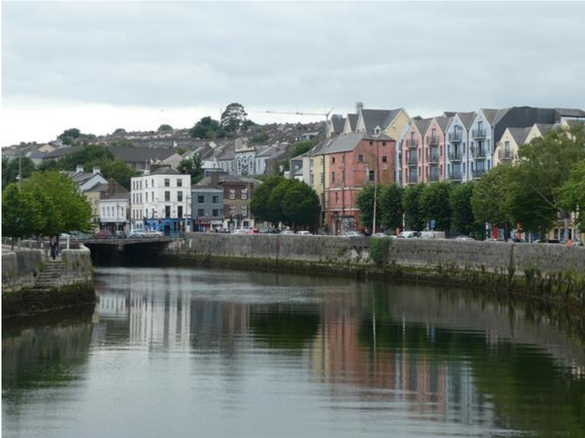
Cork, kades langs de Lee.

dagen erna heb ik Cork nog wat verder verkend en de vier musea bezocht die de stad rijk is: het Buttermuseum, de Crawford Art Gallery, de Cork City Hall en het Cork Public Museum.