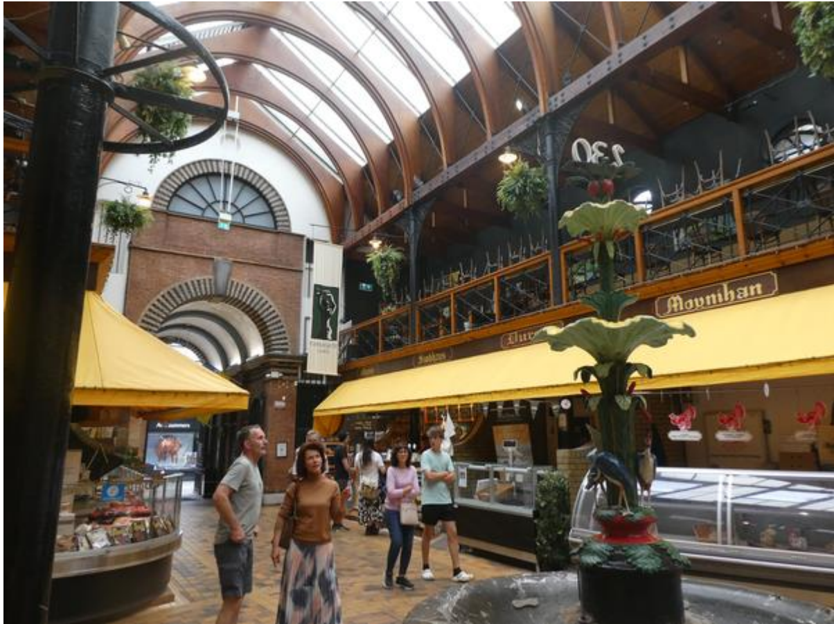
The English Market in Cork.

Erg groot is het centrum van Cork niet en had ik ruim de tijd om de belangrijkste bezienswaardigheden te bezoeken. Allereerst het oudste gebouw, de uit 1720 daterende St. Anne's Church, gelegen in een oud buurtje aan de overkant van de andere tak van de rivier. Ik heb ook de toren beklommen. Omdat ik vlak langs de klokken zou lopen, kreeg ik een paar oorbeschermers mee. Het uitzicht over de stad en het omliggende heuvelland was het klimmen waard. Daarna heb ik de English Market bezocht, een uit de Victoriaanse tijd daterende overdekte markt met voedingswarenwinkel-tjes waar biologische producten worden verkocht. Er was ook nog een oud buurtje waar zich aan het eind van de 17 e eeuw een grote groep Franse hugenoten had gevestigd, meestal ambachtslieden. Het deed een beetje aan de Jordaan denken, maar bestond uit maar twee straatjes. Er stond een voormalige Franse kerk die wel wat weg had van de Waalse Kerk in Amsterdam, alleen was hij opgetrokken uit natuursteen en verkeerde hij helaas in vrij slechte staat. Hij stond te koop en op het verkoopbord stond dat het gebouw uitstekend geschikt was om er een grote winkel of bazaar in te vestigen. Zonde dat het geen andere bestemming kon krijgen. De