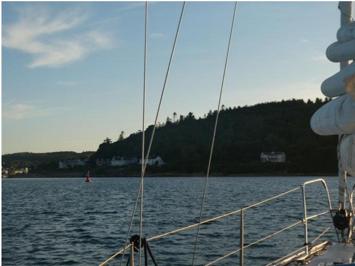
Bijna bij de jachthaven van Crosshaven.

moest ik me goed concentreren op de navigatie, want de geul kronkelde enorm en er lagen overal jachten aan meerboeien.