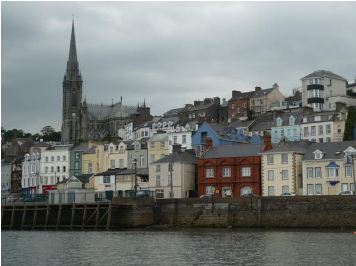
Op weg naar Cork passeer ik Cobh.

heel verhaal te horen in het Iers. Het was de eerste keer dat ik dat hoorde spreken. Het klonk mooi en zangerig en bevatte veel a-klanken, maar ik verstond er natuurlijk niets van. Daarna volgde de Engelse versie. De telefoon kon niet worden opgenomen, maar als ik een bepaald nummer intoetste zou ik teruggebeld worden. Dat gebeurde een half uurtje later door een vriendelijke dame. Ze vertelde dat de gastensteiger niet meer door de gemeentelijke havendienst werd geëxploiteerd en gaf me het nummer dat ik moest bellen. Dat had ik al, want het was hetzelfde als het nummer dat de havenmeester me had gegeven. Ik heb weer gebeld, maar er werd weer niet opgenomen. Ik heb het tegen de havenmeester gezegd en die adviseerde om maar gewoon op de bonnefooi naar Cork te varen.