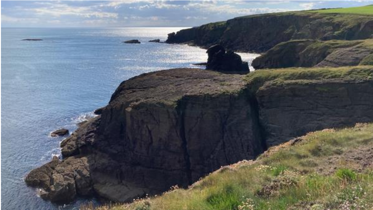
Kliffen bij Dunmore East.

was bepaald niet de enige die van al dit moois kwam genieten. Bij het passeren werd ik iedere keer vriendelijk gegroet en als er even pas op de plaats moest worden gemaakt omdat het pad wat smal was, werd er vaak een praatje gemaakt. Het viel me op hoeveel mensen er rood haar hadden, zeker één op de vier.