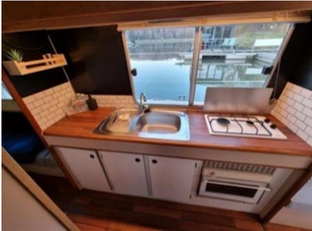
De keuken, met een weids uitzicht.