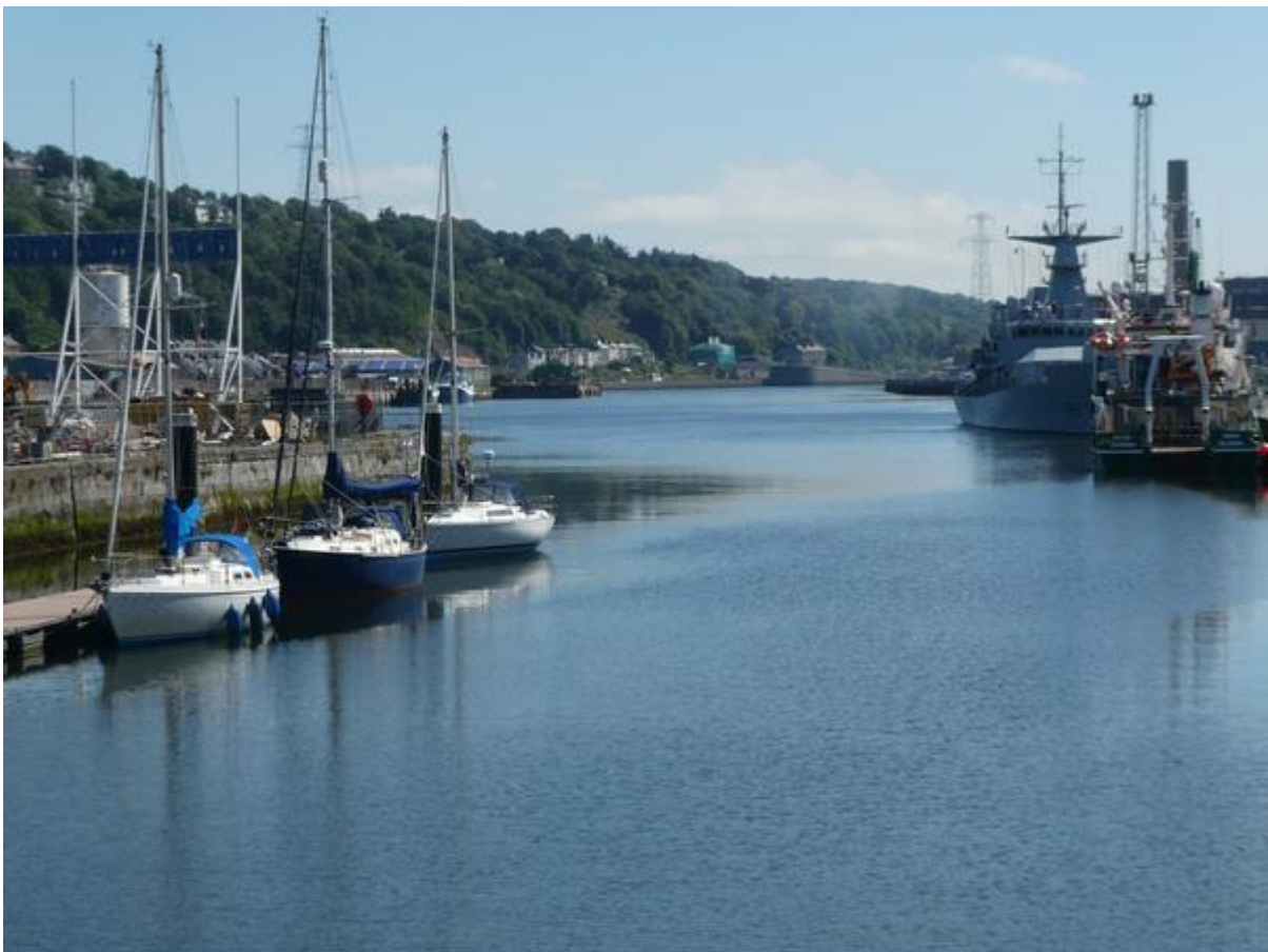
Aangemeerd in Cork.

Gelukkig meerde er een uurtje na mij een Iers zeiljacht aan. Ik heb de alleen varende schipper even geholpen met het aanmeren en gevraagd of hij wist wat de code van het hek was. Die wist hij gelukkig, Hij vertelde dat de gemeente Cork onlangs de hele punt van het eiland, waarop het voormalige havenkantoor en het douanegebouw stonden en een oude douaneloods, samen met de steiger verpatst had aan een vastgoedontwikkelaar. Die wilde helemaal op de punt, waar je een schitterend uitzicht over de rivier had, luxeappartementen neerzetten. Men was daar al mee bezig. Om zoveel mogelijk aan de steiger te kunnen verdienen was het liggeld flink verhoogd. Ik zou bijna 40 euro per nacht moeten betalen en er waren geen toiletten en douches meer en ook geen havenmeester, en om kosten te besparen werd de telefoon meestal niet opgenomen. Hij gaf me zijn telefoonnummer zodat ik hem kon bellen als ik problemen had met het verlaten of betreden van het terrein. Hoewel ik niet erg gemotiveerd was om de kas van dit afzetterszootje te spekken, heb ik de volgende dag weer geprobeerd om te betalen, nu niet door een code te scannen maar door een app te downloaden. Dat lukte wel.