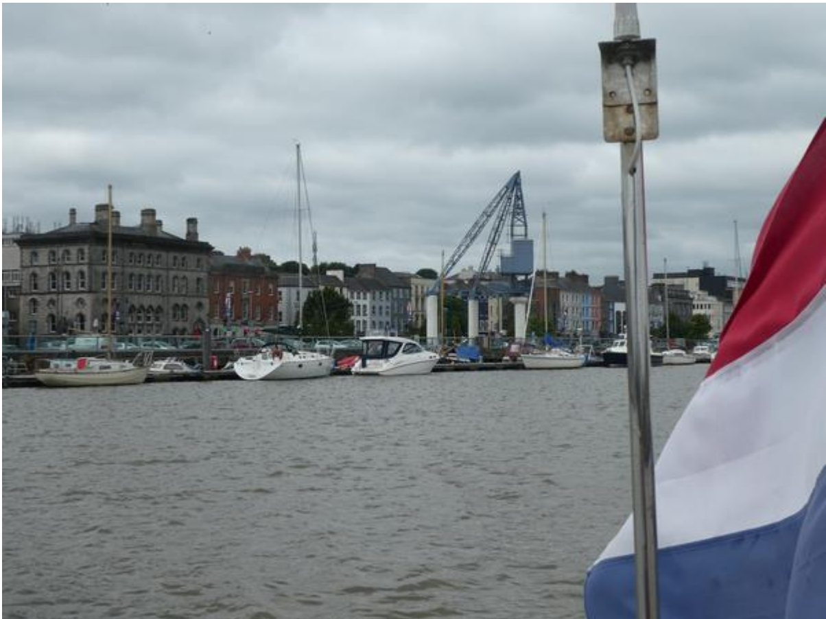
Afscheid van Waterford.

ons nodig zijn om het stikstofgehalte terug te dringen. Het was mijn bedoeling om naar de tuinen van een oud landhuis te fietsen, maar die waren helaas gesloten.