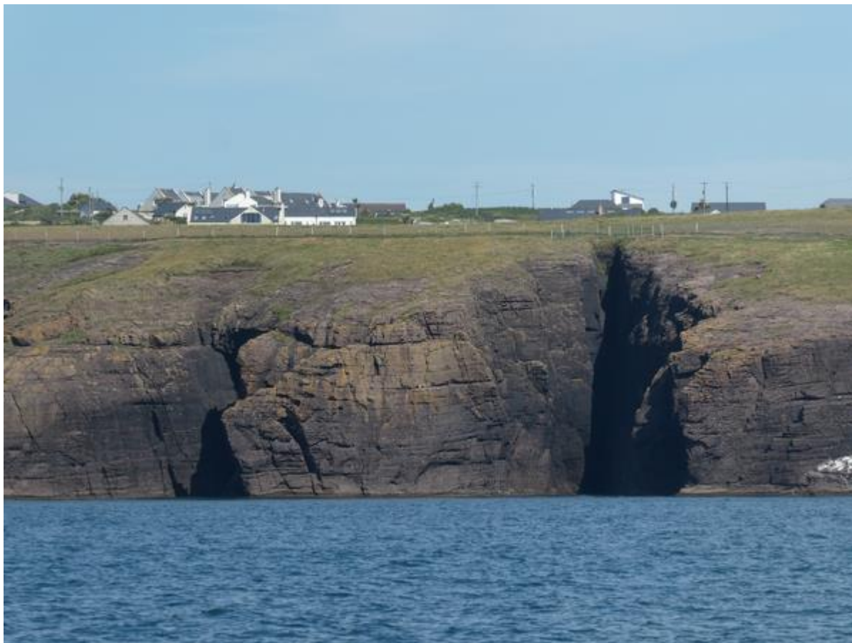
De kliffen waarover ik de dag ervoor heb gewandeld.

Om optimaal van de stroom te profiteren hoefde ik niet erg vroeg te vertrekken en even na tien heb ik Dunmore East verlaten. De zon scheen overvloedig en omdat er nauwelijks wind stond, was de temperatuur zeer aangenaam. Nadat ik de stuurautomaat opdracht had gegeven om de uitgezette te koers te volgen, ben ik met een boek en de afstandsbediening van de stuurautomaat tegen de mast gaan zitten. Daar zie je het best tegenliggers en kreeftenboeitjes. Terwijl de stuurautomaat ervoor zorgde dat het schip op koers bleef, kon ik genieten van het uitzicht op de kliffen waarover ik de vorige dag had gewandeld. De kaap tot waar ik was gelopen, was ik al na een kwartiertje gepasseerd. De zee was bijna spiegelglad, maar op een gegeven moment zag ik in het zuiden het water donker worden. Wind! Bij de mast werd het nu te fris en er moest ook actie ondernomen worden, want ik kon zeilen. Ik heb snel de genna uitgerold en met een zwak tot matig windje kon ik hoog aan de wind mijn koers vervolgen. Bij deze windkracht loopt het schip aan de wind het hardst en door ook nog wat stroom in de rug voer ik gemiddeld zo'n 6 tot 7 knoop. Dat was ook wel nodig want op een gegeven moment zou ik stroom tegen krijgen.