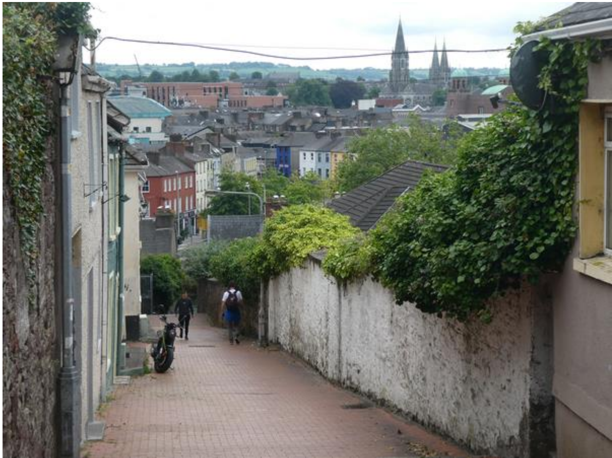
Uitzicht vanaf het straatje naar de Cork City Goal.

tijd veranderden die hun verdienmodel door handelsnederzettingen te stichten, en zo werd Cork een handelsstad.