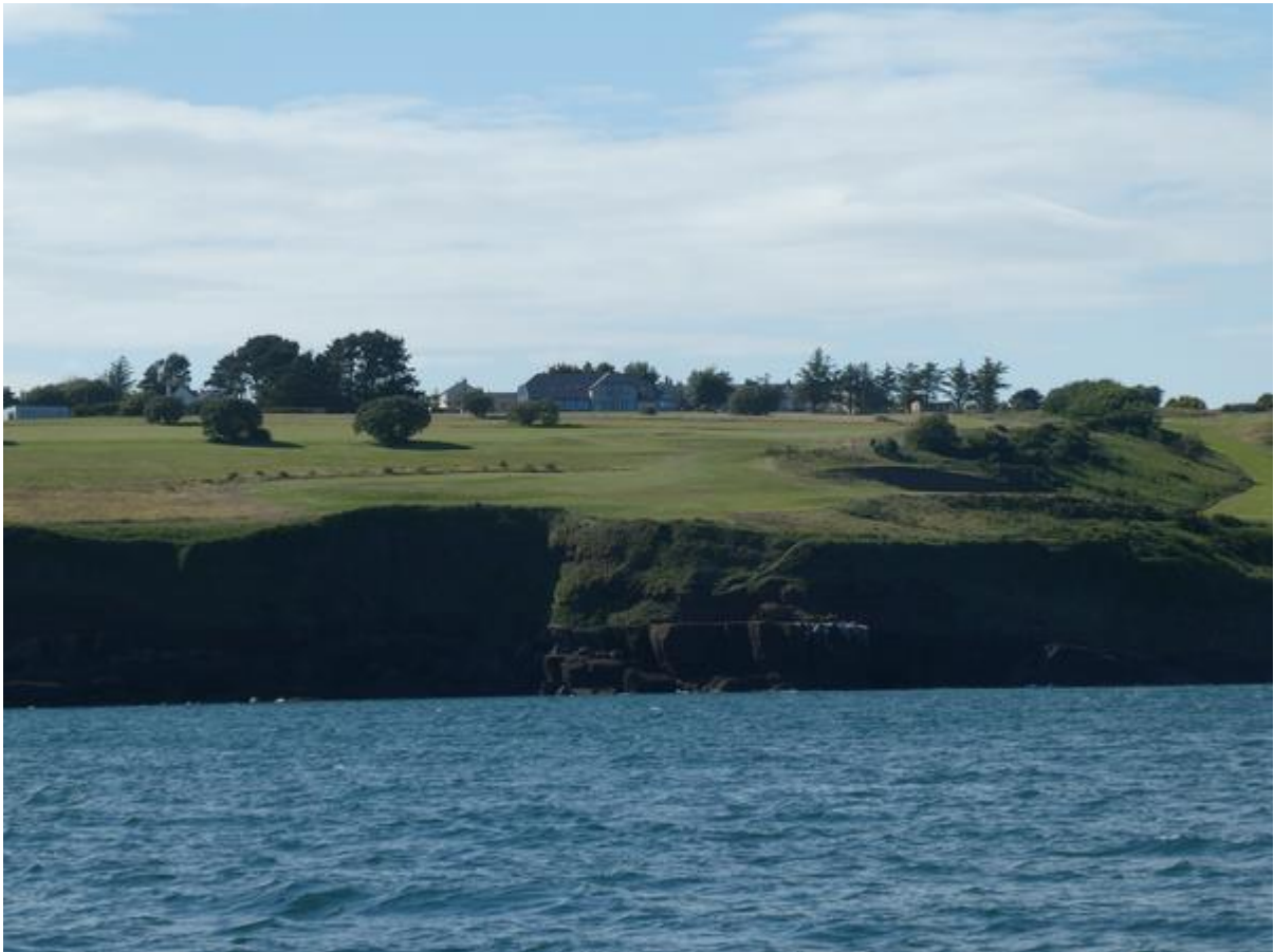
Oostoever van de Sourmonding.

wat heuvels en daarachter rezen de Wicklow Mountains hoog op. In het westen waren ook de grijze contouren van de Monavullagh Mountains te zien. Vlak na Kilmore Quay passeerde ik een aantal kreeftenboeitjes, maar daarna zag ik er geen enkele meer. Daardoor werd ik wat minder oplettend en dat kwam me aan het eind van de tocht bijna duur te staan. Net toen ik een foto wilde maken van de markante vuurtoren bij de monding van de Sour zag ik schuin voor het schip twee door een lijn verbonden boeitjes. Ik passeerde ze rakelings, maar als ik ertussendoor was gevaren, had ik muurvast gezeten. Gevaarlijke rotsen en zandbanken staan allemaal op de kaart en een wilde zee kun je vermijden door goed de weerkaarten te raadplegen en naar de weerberichten te luisteren, maar kreeftenboeitjes kom je onaangekondigd tegen en zijn niet verlicht. Daarom ben ik er tijdens mijn reizen door de Ierse, Britse en Franse wateren het meest bang voor.