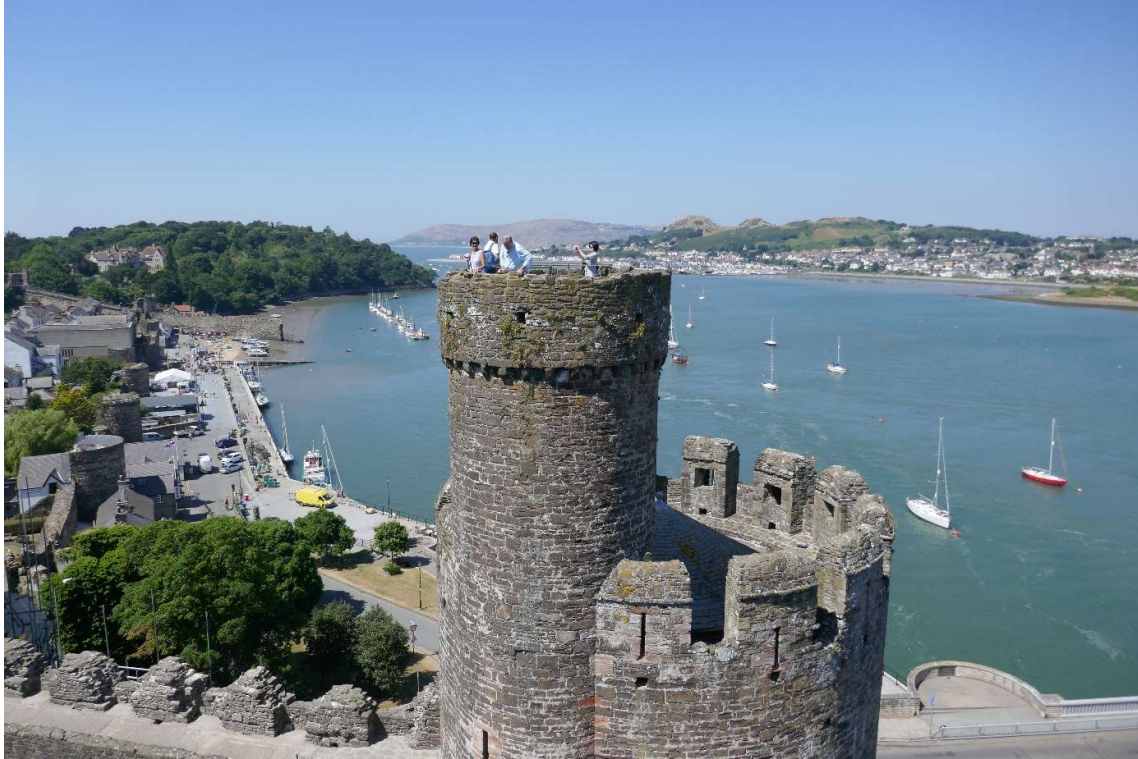
Uitzicht vanaf Conwy Castle over de rivier.

De volgende morgen ben ik weer naar het stadje gefietst, nu om een paar oude huizen te bezoeken: een ruim 700 jaar oude koopmanswoning en een laat-16 e -eeuws stadpaleis dat qua bouwstijl veel weg had van de herenhuizen die in die tijd in Antwerpen werden gebouwd. De rijke koopman die het had laten bouwen was daar geweest en wilde net zo'n prestigieus huis hebben als de rijke Antwerpenaren. Na mijn bezoek aan het grootste huis van Conwy heb ik het kleinste huis van de stad en van heel Groot-Brittannië bezocht. Het was een piepklein, tegen de stadsmuur gebouwd huisje met één kamer, van ongeveer 2 bij 2.5 meter, en een vlierinkje waar net ruimte was voor een bed. De laatste bewoner was een oude visser. Vergeleken met hem leef ik op de boot heel wat ruimer.