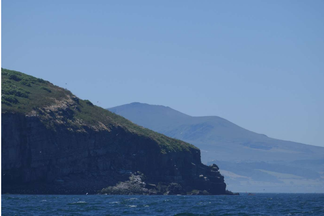
Uitlopers van de Snowdonians, een paar mijl voor Conwy.

Door de sterke stroom stond er in de oostelijke monding van de Maine Strait een vervelende golfslag. De wind, die wat sterker was dan de vorige dagen, was oost en daarom pal tegen, maar toen ik het eilandje voor de monding had gerond, werd mijn koers zuidoost en kon ik tot aan de rivier waaraan Conwy lag, lekker zeilen. De hoge uitlopers van de Snowdonians liepen hier tot aan de zee en het uitzicht op de kust was overweldigend.