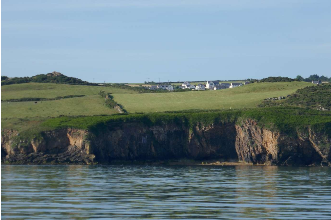
Kust tussen Fishguard en Aberystwyth.

Mijn volgende bestemming was een universiteitsstadje met de onuitspreekbare naam Aberystwyth. Rogers vrouw had me verteld dat “ystwyth” in het Welsh “monding” betekent. De meeste Engelsen, die de naam ook niet kunnen uitspreken, noemen het daarom maar gewoon Abermound. De weersomstandigheden waren vrijwel hetzelfde als de dag ervoor: bijna geen wind, overvloedige zonneschijn en een vrijwel strakblauwe hemel. Maar ik had wel gezien dat de barometer wat was gezakt en dat gaf mij de hoop dat er na de middag een zeebries zou opsteken. In Zeeland kon je daar bij dit soort hogedrukweer bijna de klok op gelijk zetten. Rond half twee kwam daar de zeewind, en ook hier was dat het geval. Hij was net sterk genoeg om te kunnen zeilen.