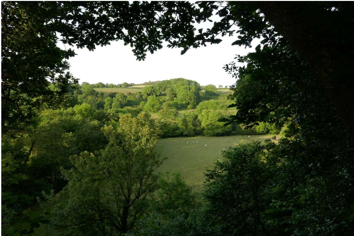
Doorkijkje vanaf het bospad bij Fishguard.

Aan het begin van het pad stond een bord met informatie over het bos en de dieren die er leefden. Het was honderden jaren oud en werd aan zijn natuurlijke lot overgalaten. Toen ik een halve kilometer had gelopen leek dat laatste ook te gelden voor het pad. In het begin was het geasfalteerd en had het ook in het Vondelpark kunnen liggen, maar gaandeweg werd het meer een woudloperspaadje. Eerst liep het vrijwel naast het riviertje, maar toen het wat begon te klimmen werd het steeds modderiger en smaller. Soms was het niet meer dan een voet breed en moest ik uitkijken dat ik niet van de steile helling afgleed, en zo nu en dan waadde ik door kleine beekjes. Vaak moest ik over omgevallen bomen klauteren en struiken wegduwen. Ik merkte dat ik al bijna boven was en hoopte daar via een landweggetje weer terug te kunnen lopen, maar toen het pad bijna helemaal overwoekerd werd door braamstruiken, ben ik omgekeerd.