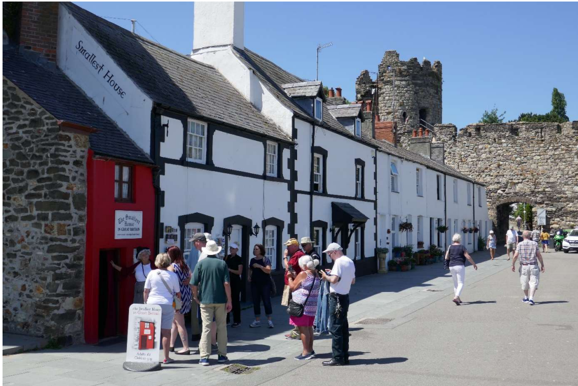
Wachtende bezoekers voor het kleinste huisje van Groot-Brittannië.

's Middags heb ik de stad verruild voor de natuur. Over de Conwy Mountains, waar ik vanaf de boot een mooi uitzicht op had, liep een pad dat over en om de toppen van de bergen slingerde. Aan alle kanten was het uitzicht schitterend. Als laaglandbewoner ben ik altijd weer onder de indruk van dit natuurschoon. In Nederland is de mens duidelijk de baas over het landschap, hier voelde ik me vrij nietig, meer nog dan op volle zee.