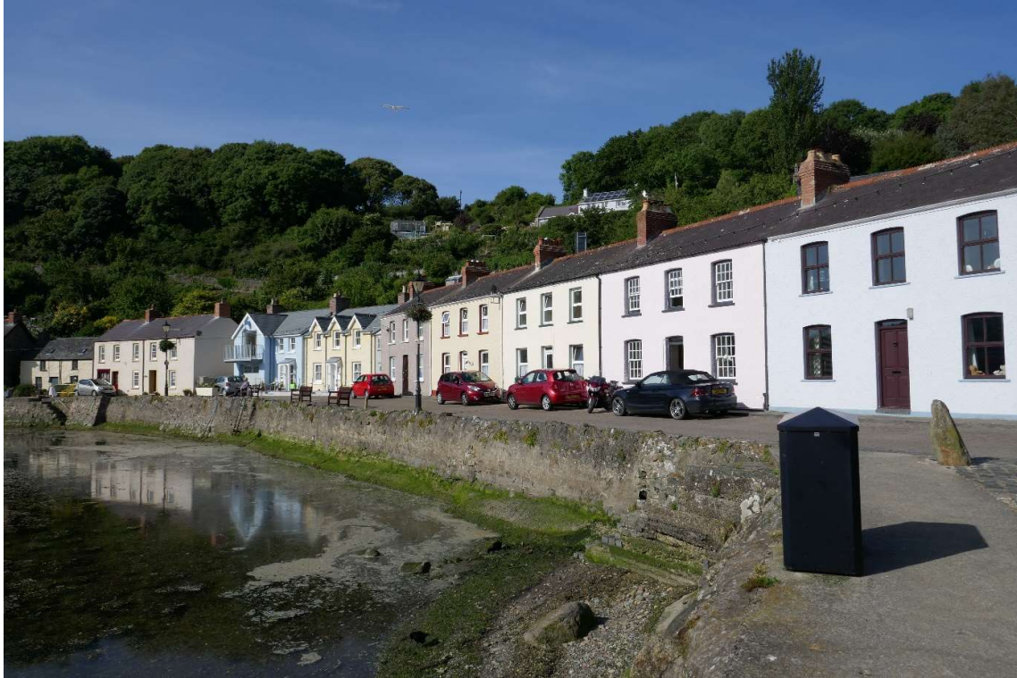
Kade langs de haven van Fishguard.

Aan de noordkust van Cornwall had ik maar één haven bezocht omdat alle andere havens droogvielen en mijn schip er op hard zand en stenen tegen een kademuur zou moeten staan. Droogvallen tegen een kademuur doe ik liever niet, maar in Fishguard had ik weinig keus. Ik had ook een meer-boei kunnen opzoeken, maar omdat ik geen brood, fruit en verse groente meer aan boord had wilde ik een bezoek brengen aan de supermarkt en daarom wilde ik langs de kade liggen. Andere havens die ik in een dagtocht kon bereiken waren er langs de westkust van Wales simpelweg niet.