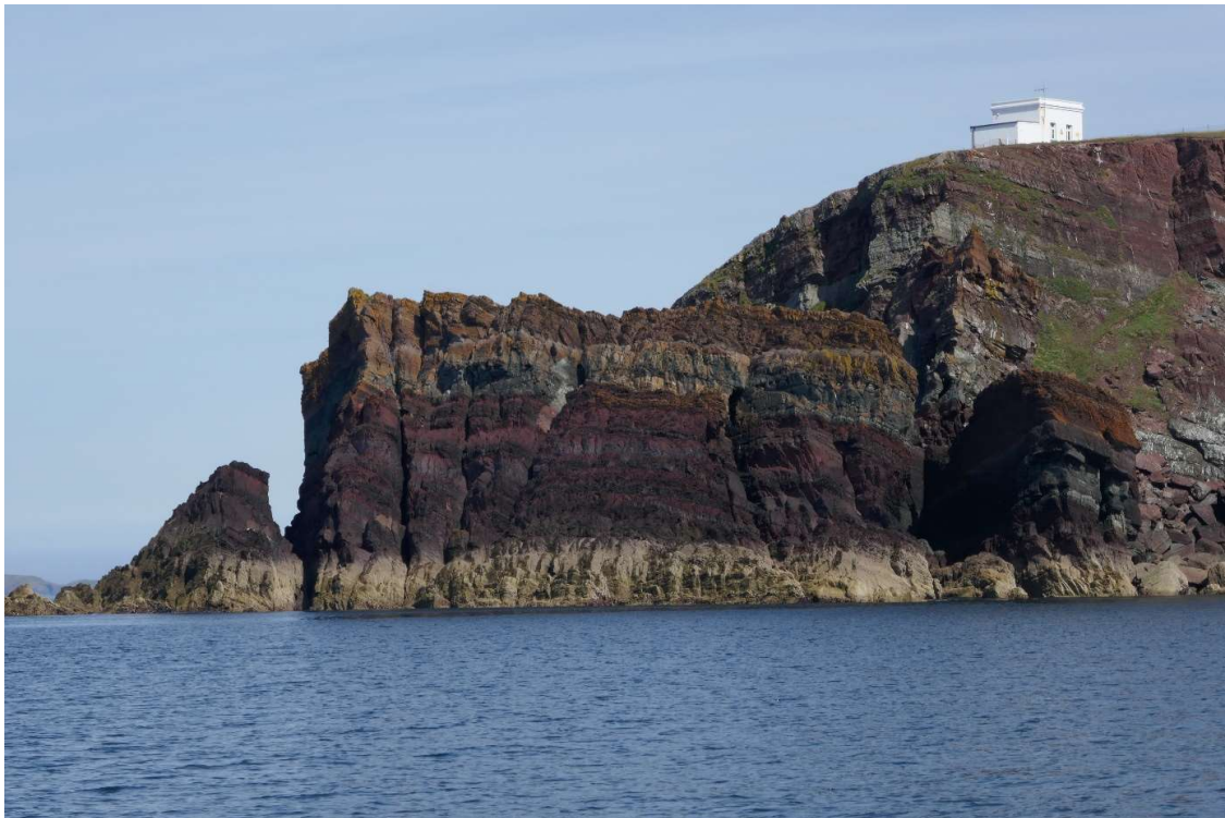
De imposante kaap bij de monding van de Cleddau.