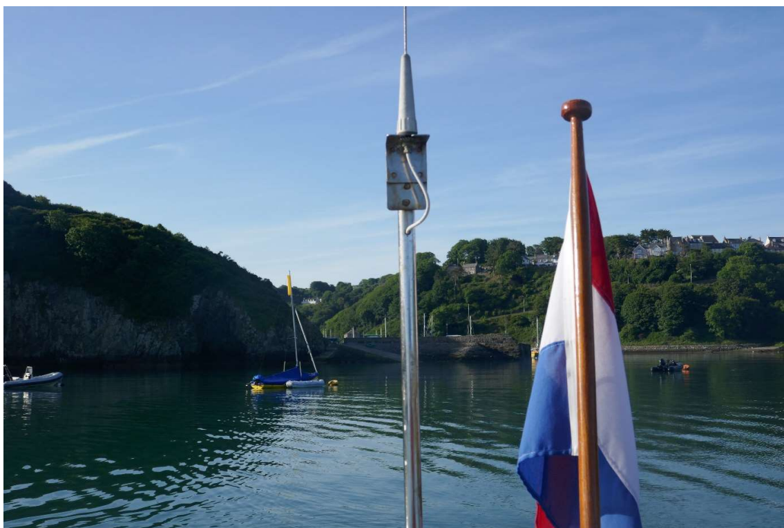
Afscheid van Fishguard.

Het was rond zessen hoogwater en omdat er alleen tot twee uur daarna voldoende water stond om de haven te kunnen verlaten, wilde ik om 7 uur opstaan en daarna zo snel mogelijk vertrekken. Toen de wekker afging heb ik direct de dieptemeter aangezet. Er stond nog ruim 2 meter water, maar toen ik me aankleedde ging het dieptealarm af, een teken dat de diepte minder dan 2 meter was geworden. Mijn boterhammen voor het ontbijt en de lunch had ik de avond ervoor al gesmeerd en omdat er vrijwel geen wind stond, kon ik makkelijk op het water koffie zetten. Ik heb snel de motor gestart en de lijnen losgegooid en even voor half acht, toen het water gezakt was tot 1,70 meter, heb ik afscheid genomen van dit schitterende haventje.