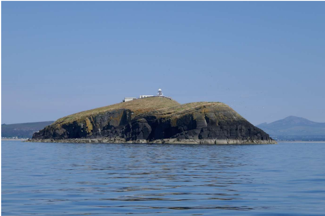
Eilandje ten zuiden van Pwllheli.

De volgende dag ben ik weer in de loop van de morgen vertrokken. Het was weer fraai zomerweer en wind stond er bijna niet. Om het schiereiland LLeyn te kunnen ronden moest ik eerst een paar mijl naar het zuiden en vervolgens naar het zuidwesten. Daarna volgde er zeer imposante, schitterende kaap en toen ik die gerond had, kon ik weer naar het noorden koersen, richting Caernarfon, een middeleeuws vestingstadje aan de Menai Street, het vaarwater tussen het vasteland van Wales en het eiland Anlesey, voor de noordwestpunt van Wales. Tussen de kaap en het eilandje dat er vlak naast lag stond een fikse stroom, helaas pal tegen, zodat ik even de motor op bijna volle kracht moest zetten. Daarna stelde de tegenstroom niet zo veel meer voor en een paar uur later kreeg ik de vloedstroom in de rug. De kust was weer zeer afwisselend. Hij bestond voor het overgrote deel uit hoge kliffen en kleine door imposante rotsblokken afgeschermd baaitjes met zandstrandjes waar het behoorlijk druk was met zwemmers en zonzonabidders.