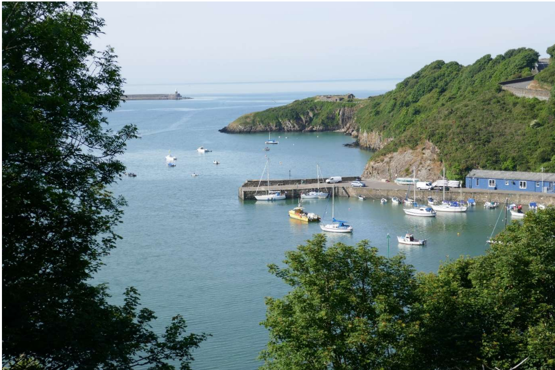
De haven van Fishguard van bovenaf, met precies in het midden de Nehalennia.