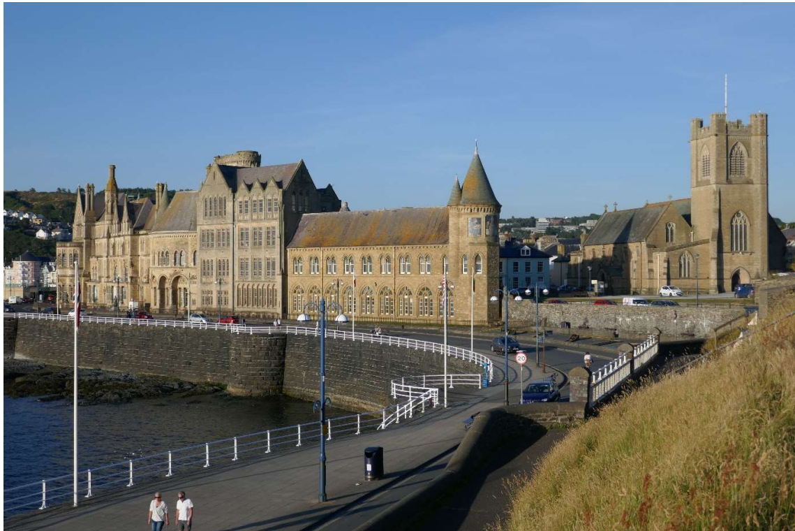
Gebouwen van de University of Wales op de boulevard van Aberystwyth. Rechts de stadskerk.

's Avonds heb ik de kasteelruïne bezocht die ik vanaf zee had zien liggen en ik heb een mooie wandeling gemaakt over de schitterende, kilometerslange boulevard met zijn pier en goed geconserveerde Victoriaanse huizen. Vlak erachter stond de stadskerk, waar ik ook even een bezoekje aan heb gebracht. De dominee die er rondliep omdat er net een kerkdienst was gehouden, schudde me vriendelijk de hand en vertelde het een en ander over de geschiedenis van de kerk.