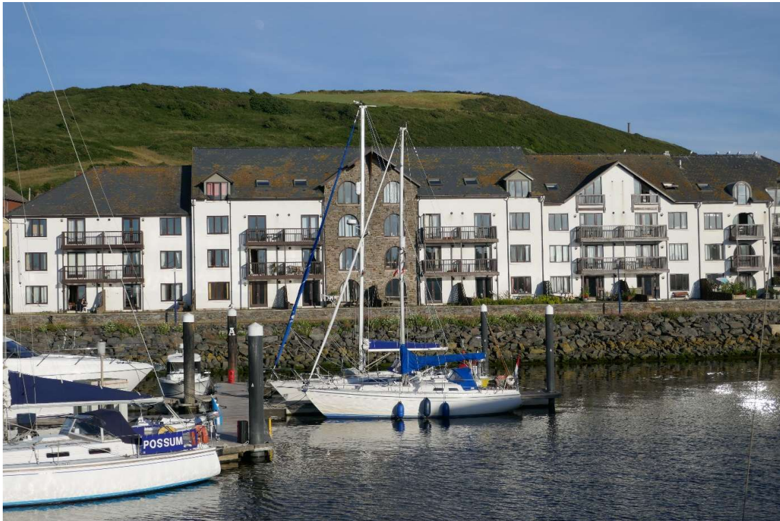
Aangemeerd in Aberystwyth.

In de buurt van Aberystwyth werd het wat drukker. Er zeilden een paar jachten en er passeerde een vissersboot. De zeewind liet het helaas steeds meer afweten en het laatste uur had ik weer de motor nodig. Ook deze haven was een getijdhaven, maar omdat het bijna hoogwater was, kon ik er gemakkelijk binnenlopen. Ik probeerde de havenmeester op te roepen om te vragen waar ik kon liggen, maar ik kreeg ik geen antwoord. Aan de eerste steiger van de vrij grote marina zag ik een lege plek, waar ik ben gaan liggen. De eigenaar van een Brits jacht dat naast me lag vertelde dat de havenmeester al naar huis was en hem had gezegd dat de steiger waar onze schepen lagen, bestemd was voor gasten. Ook hij stelde zich direct voor en vroeg hoe ik heette. Zijn zoon was net de kajuit uitgekomen om zijn vader een biertje te overhandigen, maar dat werd gelijk aan mij doorgegeven.