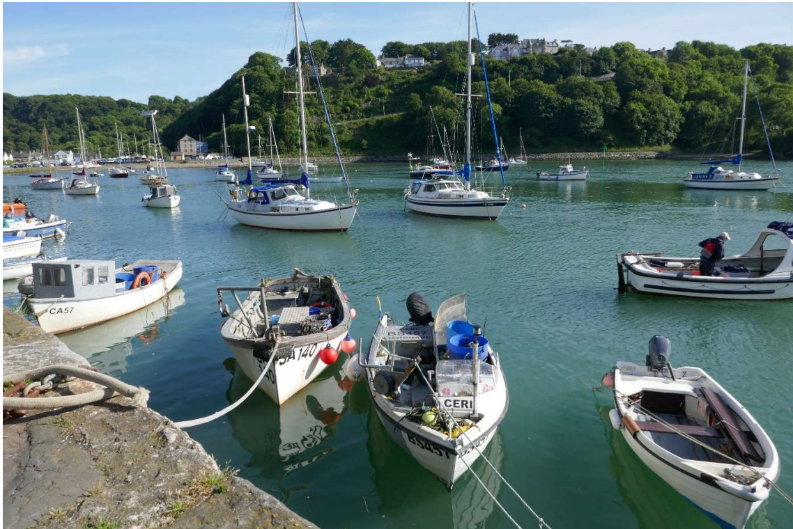
Vissersbootjes en jachten in de haven van Fishguard.

Volgens de vaargids was de haven van Fishguard tussen twee uur voor en twee uur na hoogwater toegankelijk. Toen ik er aankwam was het net hoogwater geweest en stond er nog 2,2 meter water, ruim voldoende dus. Omdat er overal schepen aan meerboeien lagen, had ik niet veel manoeuvreerruimte. Via de marifoon had ik geprobeerd om aan de havenmeester te vragen waar ik kon liggen, maar ik kreeg geen contact. Aan de kade was het druk bezet met kleine vissersbootjes, maar helemaal aan het begin, direct na de haveningang en vlak voor een zeiljacht dat er net was aangemeerd, was nog een plekje. Toen ik ernaartoe draaide heb ik aan een visser die net van zijn bootje afstapte gevraagd of ik daar kon liggen. Geen probleem, hij zou me wel even helpen bij het aanleggen. Er was een trapje en daar moest ik met mijn mast precies voor gaan liggen. Aan beide kanten van het trapje hingen staven met losse ringen waar ik mijn voor- en achterlijn doorheen kon halen. Mijn enige ervaring met droogvallen tegen een kademuur was in de getijdehaven van het Zeeuws-Vlaamse Paal. Om ervoor te zorgen dat mijn schip niet om kon vallen had de havenmeester mij toen geadviseerd om een lijn om mijn mast te doen en die vast te maken aan de wal. Dat wilde ik hier ook doen. Ik heb daarom aan de mast twee lijnen vastgebonden en die door de ringen gehaald.