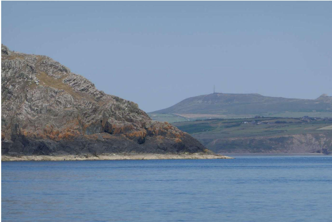
Rotskliffen en kleine baaien wisselen elkaar voortdurend af.

lagen flink wat boeitjes, het leek wel of de vissers ze met opzet precies in de doorgangsroute hadden gelegd, en een paar keer moest ik even mijn koers verleggen. Daarna kwam ik er urenlang geen meer tegen, en omdat hier geen havens lagen verwachtte ik dat dat voorlopig zo zou blijven. Voortdurend de zee afspeuren is bijna ondoenlijk, zeker als je alleen bent, maar om de paar minuten keek ik toch goed om me heen.