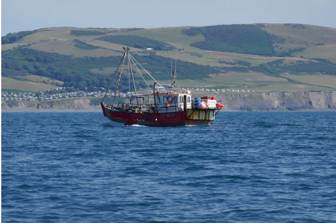
Vlak voor Aberystwyth word ik gepasseerd door een vissersboot.

Op zee was het zeer stil. Bij Fishguard voeren nog wel wat visbootjes, maar daarna heb ik lange tijd geen schip meer gezien. Ook wat betreft de zeevogels was het zeer rustig. Meeuwen waren er bijna niet, soms zag ik een jan-van-gent en een enkele keer scheerde er een noordse stormvogel om de boot. Niet ver van Aberystwyth veranderde dat plotseling. Ik zag zwermen stormvogeltjes om me heen die voortdurend het water in doken, het waren er zeker honderden. Toen ik goed keek zag ik dat het water waar ze in doken erg onrustig was. Er sprongen allemaal kleine zilverkleurige visjes naar boven. Ze probeerden waarschijnlijk te ontkomen aan de vraatzucht van een school makrelen, maar nu stonden ze op het menu van de stormvogeltjes.