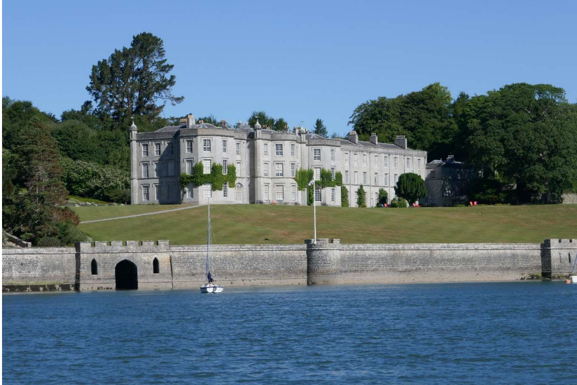
Landhuis op de noordoever van de Maine Strait.

De havenmeester zei dat ik het beste een kwartier na de opening van de havendeur kon vertrekken, dan had ik ruim anderhalf uur stroom in de rug en was ik even voor hoogwater bij de Swells. Het was weer schitterend weer en het uitzicht op de grotendeels beboste oevers, waar fraaie landhuizen stonden, was heel mooi. Bij de Swells had ik echter al mijn aandacht nodig voor de navigatie. In de vaargids stond een foto van een jacht dat hier op de klippen was gelopen en zo wilde ik in ieder geval niet eindigen. Alles ging goed, maar wat ik minder leuk vond was dat vlak voor de passage de snelheid van het schip plotseling afnam. Het werd daardoor minder goed bestuurbaar. Er dreven nogal wat waterplanten en wierseldjes en ik vermoedde dat er iets voor de kiel of het roer was blijven hangen. Toen ik in wat rustiger water kwam, ben ik even achteruit gevaren om de ballast kwijt te raken. Dat hielp, de snelheid was daarna weer normaal.