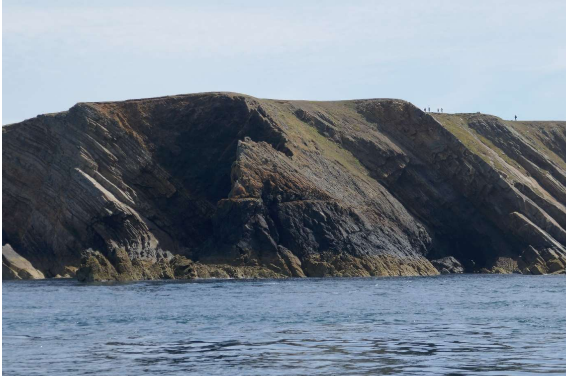
Schuinstaande, gelaagde rotsformaties aan de kust van het Pembrokeshire National Park. Rechtsboven wat wandelaars.

Toen ik de eilandjes achter me had gelaten werd het een stuk rustiger. Ik had weliswaar nog steeds de ebstream tegen, maar erg hard liep die hier niet en na een paar uur varen kreeg ik stroom in de rug. Het uitzicht op de kust was ook hier schitterend. Stukken klifkust, imposante kapen en kleine baaitjes met hoge heuvels erachter wisselden elkaar voortdurend af. Aan het eind van de middag kwam de hoge kaap in zicht waarachter de baai van Fishguard verscholen lag. Volgens mijn vaargids was de haven zeer pittoresk en toen ik de baai indraaide kon ik dat volledig beamen. Van alle havens die ik tot dan toe bezocht had, waren deze en die van Dartmouth de mooiste. De haven lag in een smal dal waarin een riviertje uitmondde. Aan weerskanten liepen de ruim honderd meter hoge oevers steil op. De noordelijke oever was rotsig en vrij kaal, de zuidelijke bebost en helemaal boven stonden een paar fraaie villa's en lag het stadje. Voor de hoge kliffen aan de noordkant was een lange natuurstenen kade met een rij schilderachtige, witte huizen.