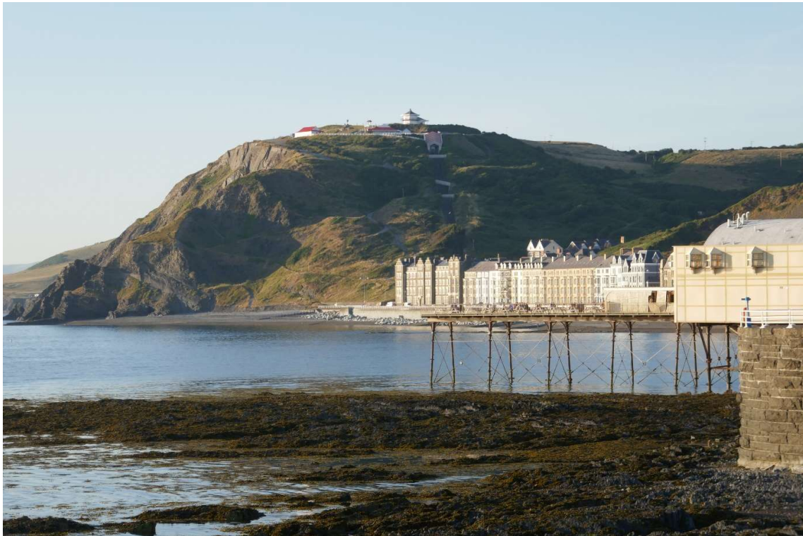
De boulevard van Aberystwyth beschenen door de avondzon.

De volgende morgen wilde ik naar Pwllheli, de laatste haven aan de westkust van Wales en de enige die bij alle getijstanden binnengelopen kon worden. Over de haven van Aberystwyth meldde de vaargids dat die tot 4 uur na hoogwater uitgevaren kon worden. Het was om tien voor zeven hoogwater. Dat betekende dus dat ik in ieder geval voor tien voor elf moest vertrekken. Maar toen ik de volgende morgen aan de havenmeester vroeg tot wanneer ik het beste de lijnen los kon gooien, adviseerde die om dat op zijn laatst om half elf te doen. Om geen risico te lopen wilde ik uiterlijk om tien uur het ruime sop kiezen.