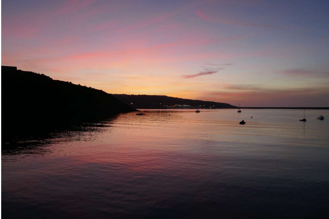
Avondstemming in de baai van Fishguard.

Toen ik weer terug was op de boot stond die nog steeds scheef. Mezelf voortbewegen op een hellend schip is geen enkel probleem, als ik hoog aan de wind zeil, is de helling vaak nog veel groter. Maar slapen op een hellend schip, hoe zou dat gaan? Toen ik in mijn slaapzak kroop rolde ik naar bakboord, maar door mijn hoofdkussen schuin tegen de wand te leggen, lag ik toch redelijk comfortabel. Toen ik na een paar uur wakker werd hoorde ik het water tegen de boot kabbelen en nog wat later merkte ik dat het schip al bijna recht lag.