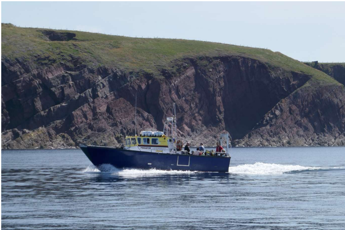
Voor de indrukwekkende rotskust van het Pembrokeshire National Park word ik gepasseerd door een parkwachtbootje.

Aan het begin van het Saint George Channel lag een archipel van eilandjes die deel uitmaakte van een beschermd natuur- en kustgebied, het Pembrokeshire National Park. De enige bewoners waren zeevogels en zeehonden. Omdat het er wemelde van de rotsen en het in de nauwe doorgangen zeer hard kon stromen, werd in de vaargids de vraag gesteld wat verstandiger was: om de eilandjes heen varen of ertussendoor? Het advies was om dat laatste alleen te doen als er weinig wind stond en het tij nog niet hard liep. Omdat de ebstroom nog maar net op gang was gekomen en er ook buitengaats nauwelijks wind stond besloot ik om tussen de eilandjes door te varen.