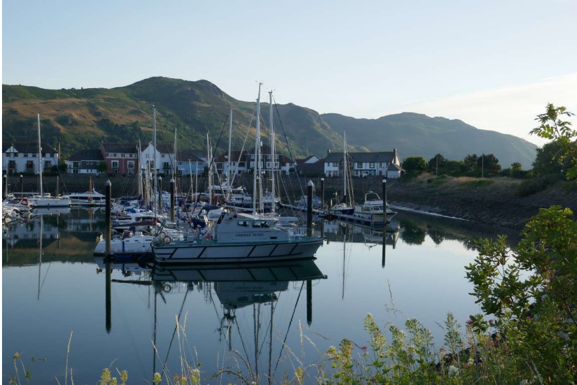
De jachthaven van Conwy.

De jachthaven lag een kilometer of twee voor Conwy, maar vlak langs de rivier onderaan de beboste kliffen liep een schitterend fiets-voetpad naar het stadje toe. De volgende dag heb ik eerst het kasteel bezocht, ook hier een goed geconserveerde ruïne waarvan alleen de muren en torens nog overeind stonden. Daarna heb ik het schilderachtige stadje verkend en een leuke wandeling gemaakt over de middeleeuwse stadsmuren. 's Avonds heb ik een mooi fietstochtje gemaakt over het fietspad dat pal onder de hoge rotsen langs de kust naar het westen liep.