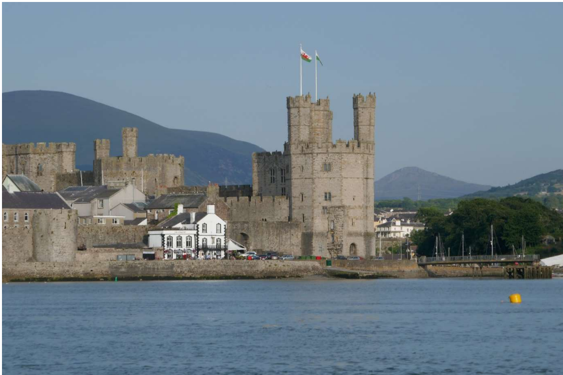
De middeleeuwse stadsmuren van Caernarfon en het Castle met daarachter de Snowdonians.

Ik heb de rest van de tocht wat vaker het water afgespeurd, maar boeitjes zag ik pas weer toen Caernarfon in zicht kwam. Wat nu de meeste concentratie vergde was het binnenvaren van de ingang van de Menai Strait. Die slingerde tussen een aantal uitgestrekte zandbanken en de drempel in de toegangsgeul viel bij eb droog. Omdat de geul zich voortdurend verplaatst, adviseerde de vaargids om niet te veel op de kaart te vertrouwen maar op de boeien. Maar er werd ook bij gezegd dat die zo ver van elkaar lagen dat ze bijna onvindbaar waren. Dat klopte. Toen ik de eerste ton passeerde, was de volgende nog nauwelijks te zien, hoewel het helder weer was. Ik had dan ook voortdurende mijn verrekijker nodig. Veel lokale watersporters varen bij voorkeur de Menai Strait in als het water laag staat. Dan staan de zandbanken droog en kun je dus precies zien waar de geul loopt. Omdat ik niet het risico wilde lopen dat de toegangsdeur tot de haven van Caernarfon gesloten zou zijn omdat het waterpeil te laag was, had ik mijn tocht echter zo gepland dat ik er voer toen het bijna hoogwater was.