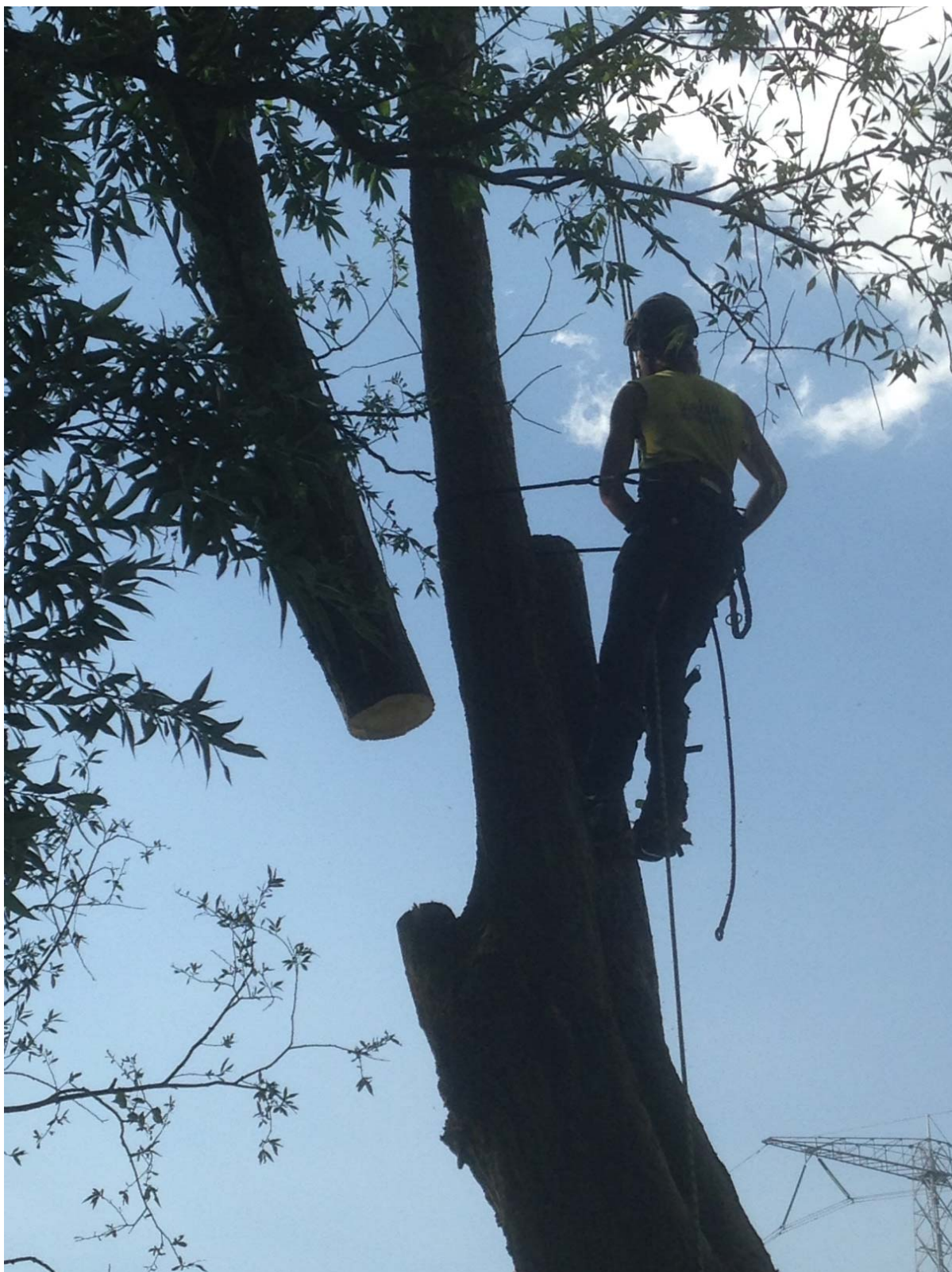
Watergeuzen verwijderen een schuin staande boom op Landje Diem