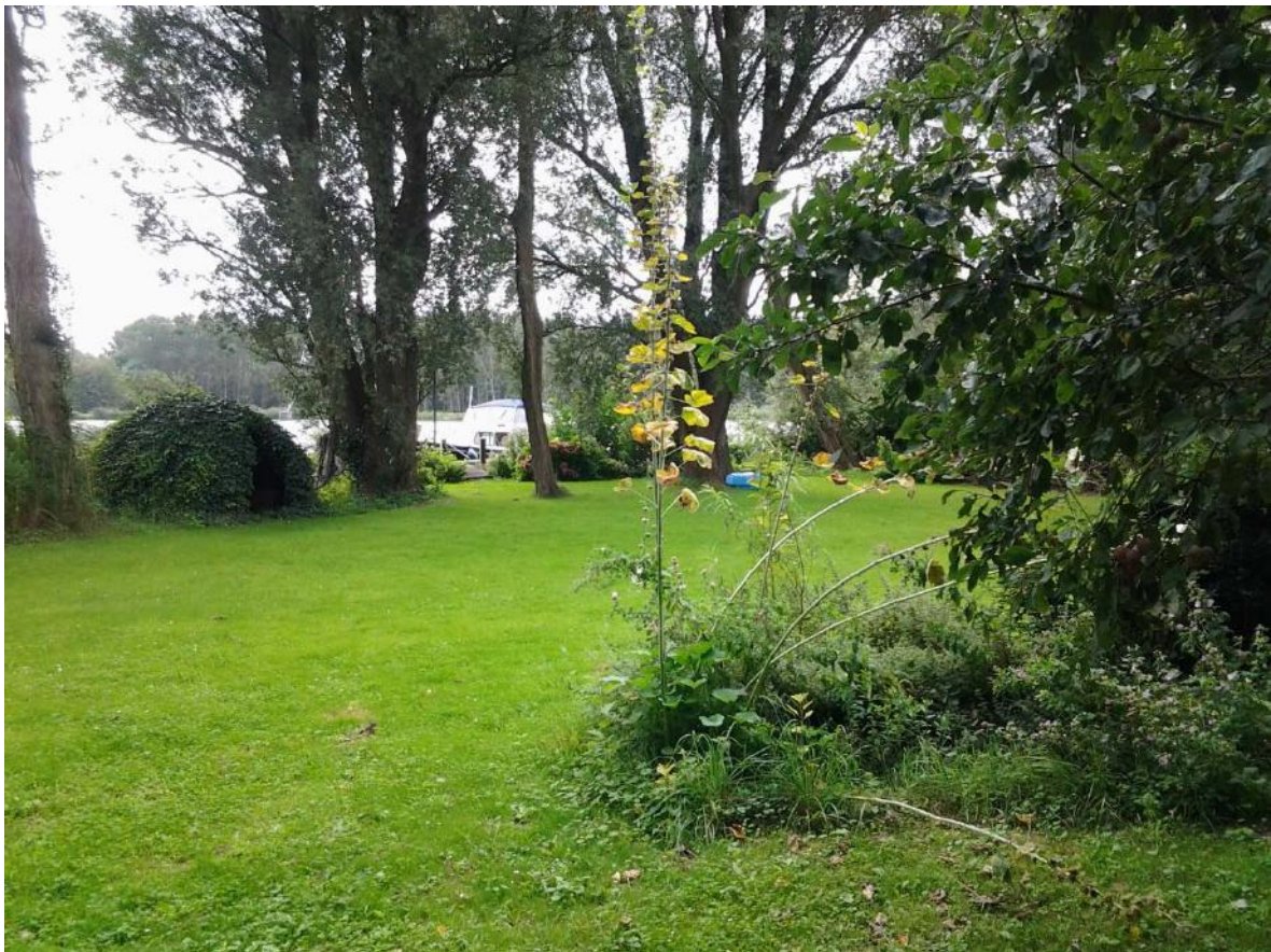
Landje Diem, achter de oude zeedijk.

Lange tijd heeft de familie Blauw het Landje bijgehouden, kruiden en vruchtbomen geplant en braambossen ontgonnen; het resultaat is een klein romantisch gebied dat het midden houdt tussen een tuin en een open plek in het bos.