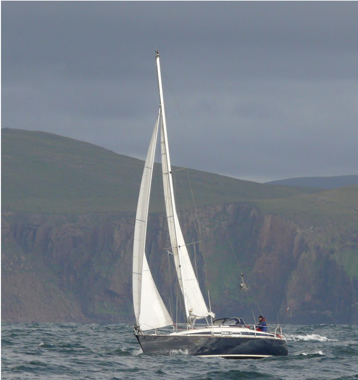
ANNA P. rondt Cape Wrath

De naam Anna P bij onze boot waren inmiddels voor ons synoniem geworden. Een andere naam dan ANNA P is niet denkbaar. Nu ruim 6 jaar geleden wilden we toch nog een keer een ander schip. We moesten ermee naar de Schotse wateren kunnen zeilen en we moesten ermee kunnen kneuteren in ondiep water in Friesland of op de wadden met een optimist en de kleinkinderen aan boord. Daarvoor is een hefkiel bruikbaar. En we vonden de Anna P.