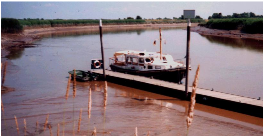
De Meijerij in Loga bij laag water