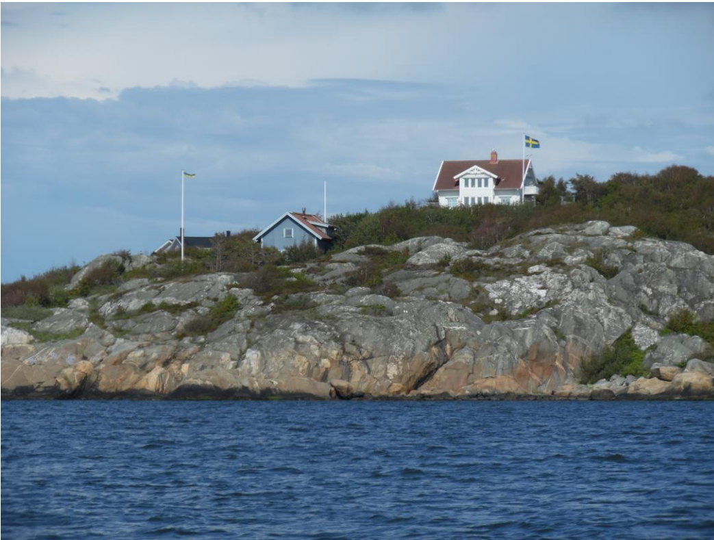
Scherenkust bij Gottskär.