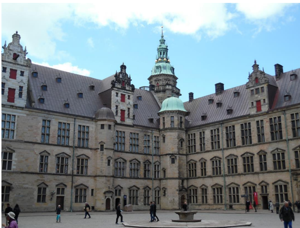
Binnenplaats van Kronborg, het voormalige tolslot aan de Sont. "De Geus" december 2015