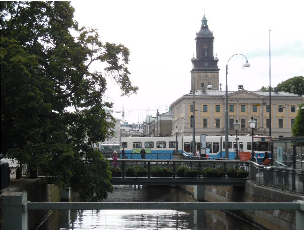
Grachtje in het centrum van Gothenborg.