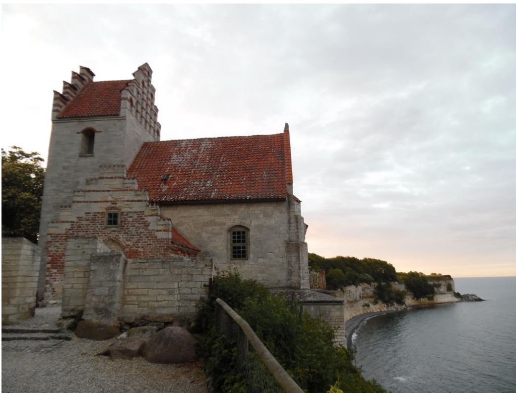
Het kerkje op de krijtrotsen van Stevns Klint.