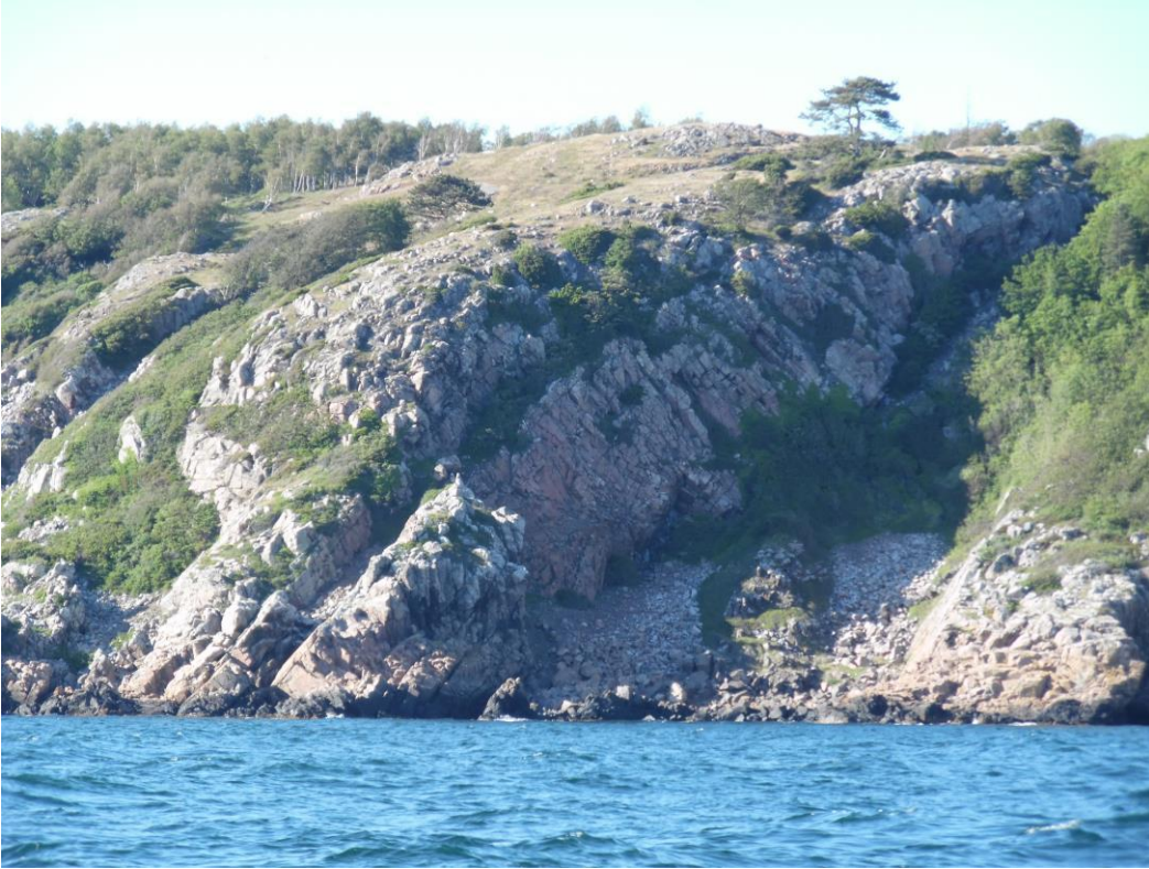
Zweden, de hoge rotskust van de Kullen.