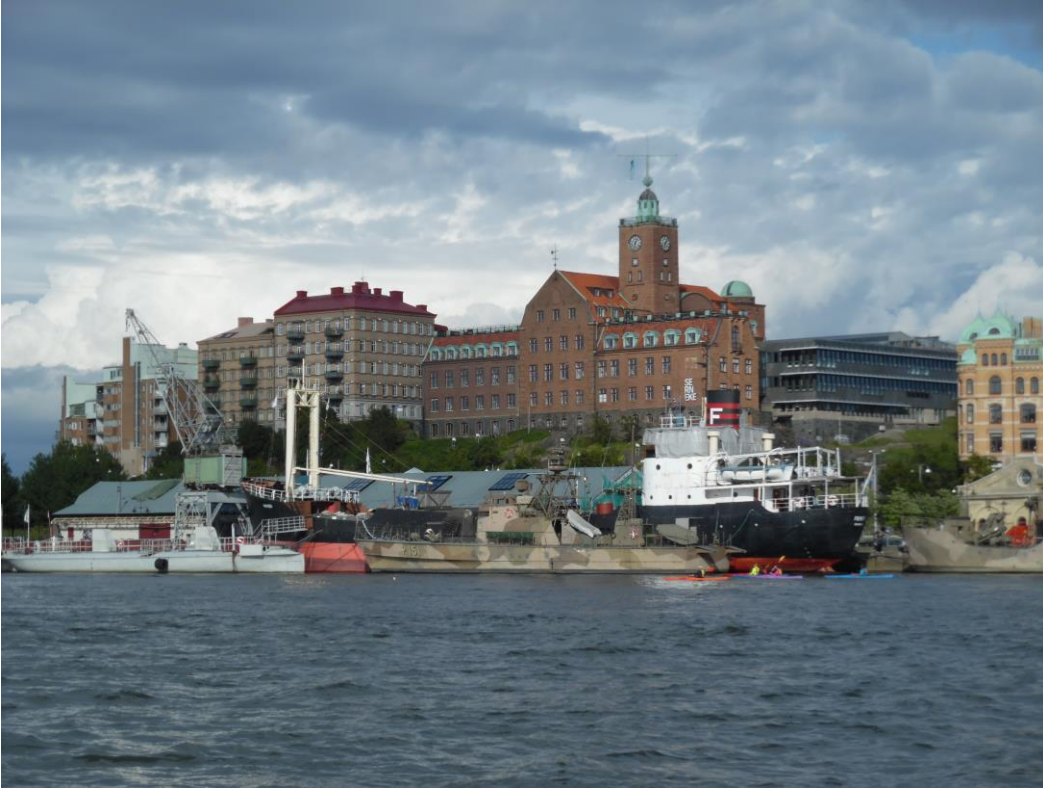
Gezicht op Gothenborg vanaf de Göta.