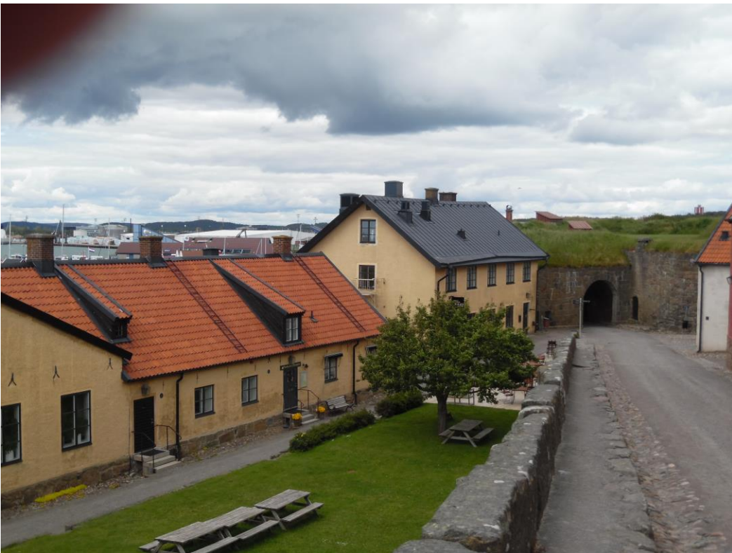
Varberg, wachtershuizen bij het oude vestingslot.