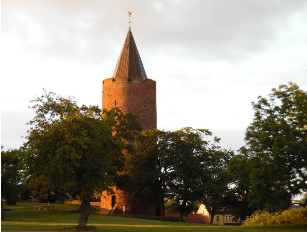
Vordingborg, toren van de middeleeuwse slotruïne.