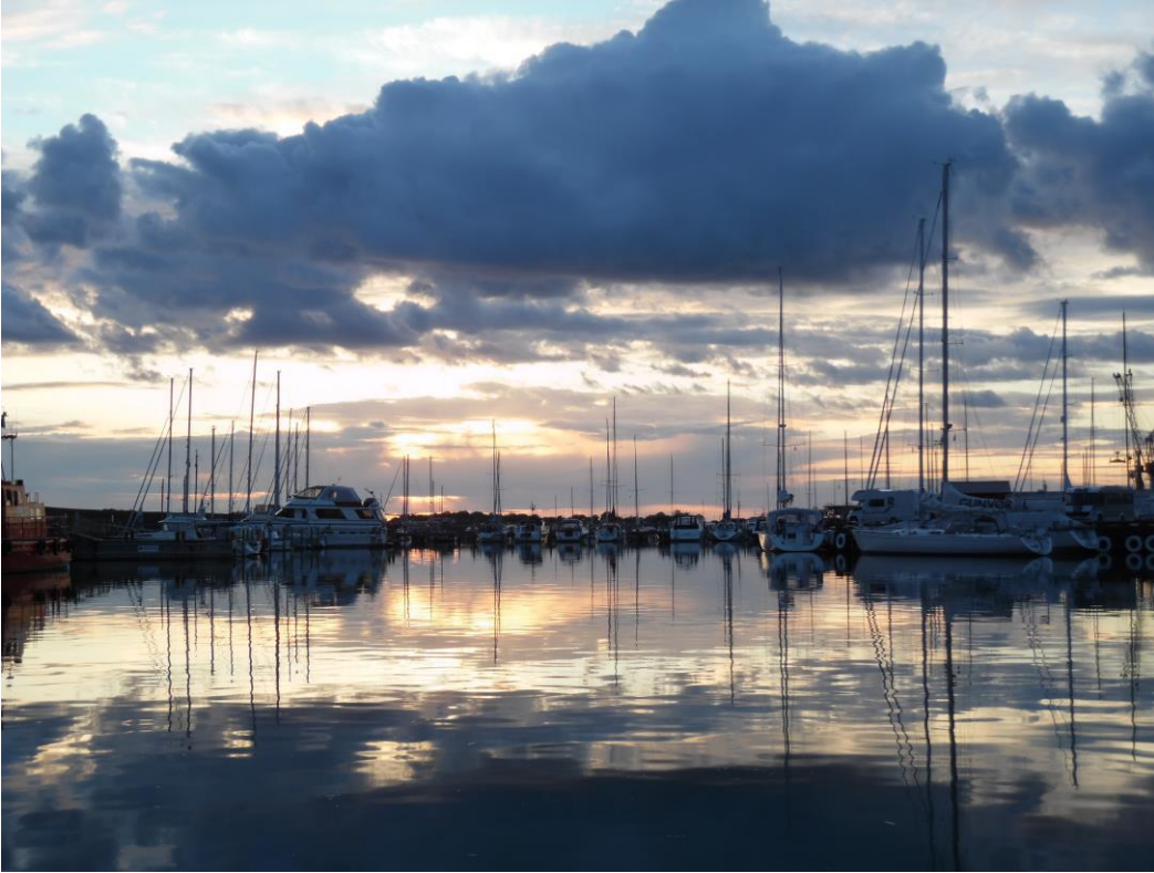
Avondstemming in de haven van Varberg.